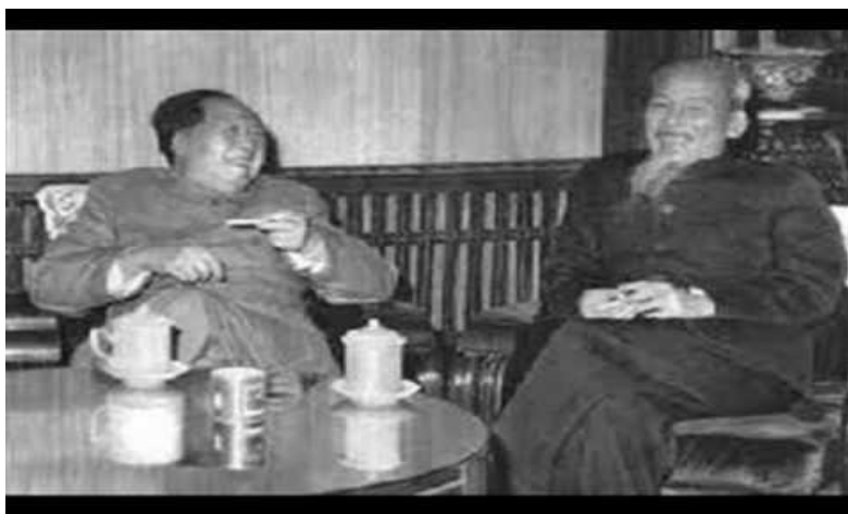
Mao Trạch Đông được Hồ Chí Minh rao bán nước Việt

Cái gien (gen), hay cái máu bành, bá của Trung Quốc, ai còn lạ. Nó có từ xưa với cái lý tưởng truyền đời mà những người có tí máu mặt trong đất nước đó thường tâm niệm, đã sống làm người thì phải : Tu thân, tề gia, trị quốc, bình thiên hạ. Cả mấy ngàn năm phong kiến, người ‘quân tử Tàu’ đã trung thành với lý tưởng ‘bình thiên hạ’( đó chỉ là cách nói tránh cho cái tham vọng muốn cướp hết đất đai của các nước khác để làm bá chủ mà thôi). Rồi đến thời cộng sản, thì họ cần phải che giấu cái ý đồ ‘bình thiên hạ’ đi. Nên ngoài miệng họ hô hào xây dựng thế giới đại đồng, chỉ để bàn tay hoạt động, tiếp tục ra sức đánh chiếm đất đai lãnh thổ, lãnh hải các nước mà họ điều tặc hòng gọi là ‘thu hồi’lãnh thổ bị mất. Một điều đặc biệt là, từ khi Trung Quốc xuất hiện đảng cộng sản thì những người cầm đầu đã không ngừng đấu đá sát phạt lẫn nhau trong các cuộc mà họ gọi là ‘đấu tranh đường lối’. Các phe phái trong đảng đấu nhau rất tàn bạo, quyết liệt, không ngán cả đầu rơi máu chảy. Thế nhưng, dù thắng dù thua, không phe nào chịu từ bỏ cái tâm đen bành trướng bá quyền.