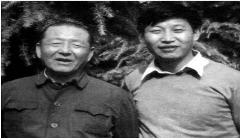
Hai cha con Tập Trọng Huân và Tập Cận Bình