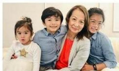
Bốn Bà Cháu