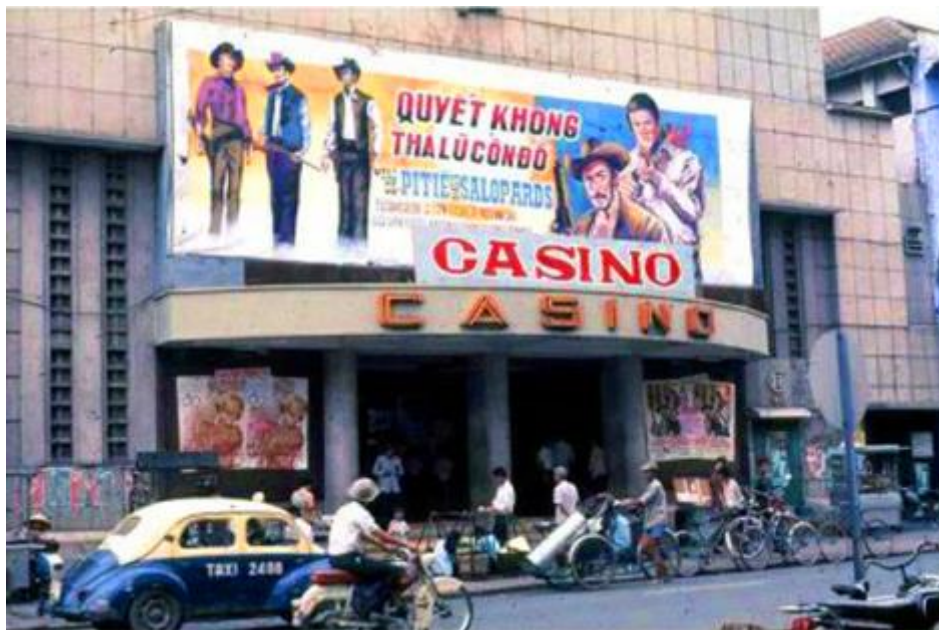
Rạp Casino Saigon ngày xưa.

không thể mời ông ăn bữa cơm với những món gia truyền như nộm rau muống, cuốn giò, cháo cá ám đã thất truyền ở VN, không nhà hàng nào làm được. Ông mời tôi ra quán Cơm Niêu cùng vài người bạn. Trước khi chia tay, đứng trên vỉa hè, ông ôm vai tôi nói lớn “Bây giờ ở đây chỉ còn mình mày”. Đây là lần thứ nhất ông xưng hô “mày tao” với tôi, chưa bao giờ tôi nghe ông xưng “mày tao” với bất cứ ai. Cái tình thân 60 năm đọng lại ở đó, sâu lắng ở đó. Tôi ngần ngại nhìn bóng dáng ông cùng bà Nhung bước lên chiếc Taxi màu vàng. Bóng dáng ông khuất sau ngã tư con đường Sài Gòn thân thuộc.