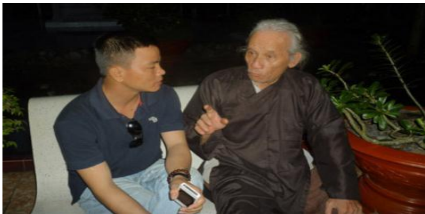
Ông Lâm cho biết, 24 năm qua không hề thấy xác ông đạo Dừa phân hủy.