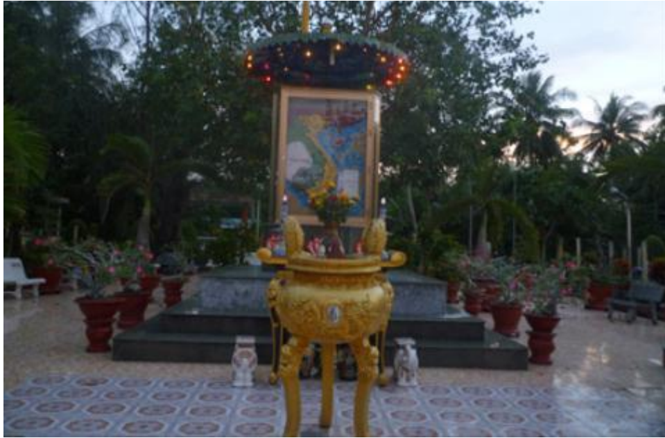
Mộ ông đạo Dừa được chôn đứng trong hộp.

Tất nhiên, tư tưởng hành đạo kỳ quái này không những phi khoa học mà vi phạm thuần phong mỹ tục, đời sống văn hóa của dân tộc nên chính quyền không cho phép. Chẳng được bao lâu, cậu Hai lại quay ngược về đất liền, dừng chân ở Hậu Giang và tiếp tục lập “cơ sở” dạy “đạo bất tạo con”. Thế nhưng ở đây, ông bị chính quyền địa phương phát hiện “mời” đi “bóc lịch” một thời gian. Trong những năm tù tội, nhiều người được chứng kiến cậu Hai ăn cơm, uống sữa, biết tắm giặt. Cuối tháng 8/1985, cậu Hai về lại cồn Phụng, được dân làng, bà con dang tay đón nhận như người con xa xứ lầm lỗi quay về. Từ chính quyền cho đến bà con lối xóm đều tạo mọi điều kiện cho cậu Hai xóa mặc cảm tội lỗi, hòa nhập cộng đồng.