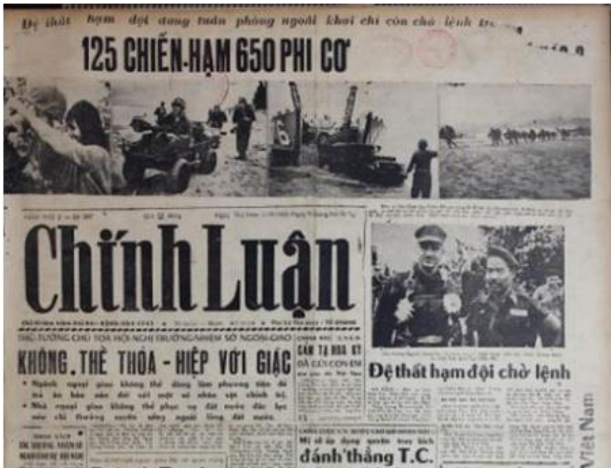
Một trang báo Chính luận.