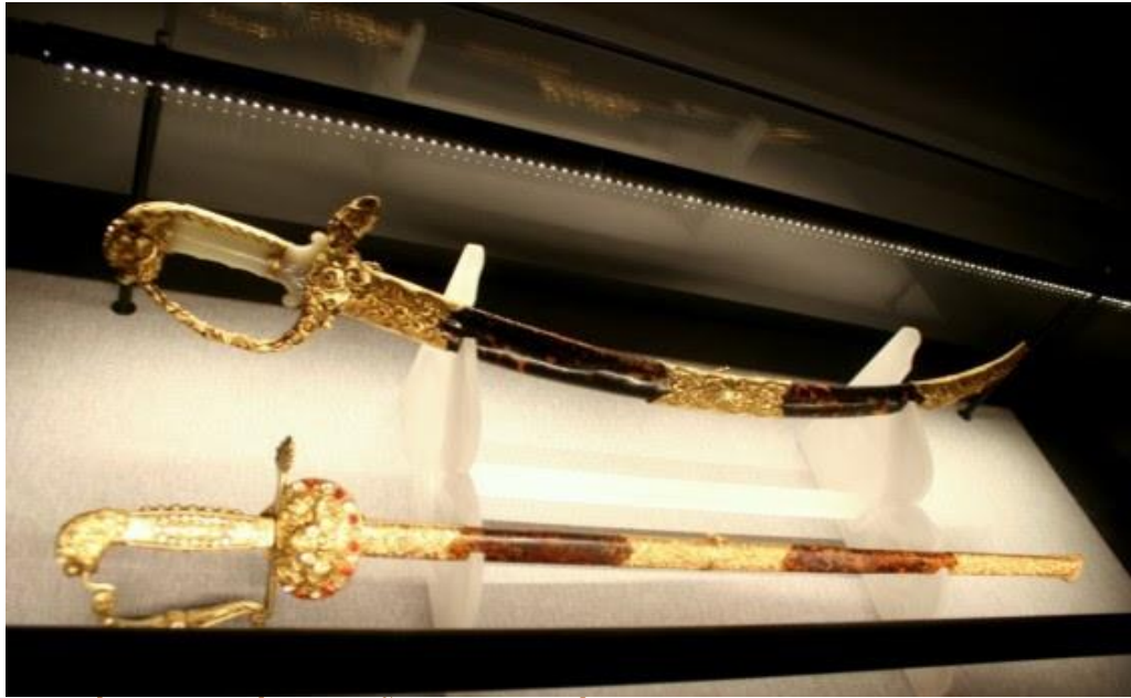
Đôi kiếm vàng triều Nguyễn đúc vào thế kỷ XIX, nặng 1,25kg tượng trưng cho quyền lực của vua