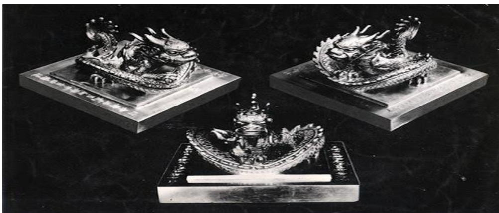
Ấn Hoàng Đế Chi Bảo bằng vàng nặng 10,534 kg vua Bảo Đại trao lại tại lễ thoái vị chiều 30/8/1945.

Một hồi sau, tại Ngọ Môn, lá cờ vàng của triều nhà Nguyễn được hạ xuống, thay vào đó là lá cờ đỏ sao vàng.