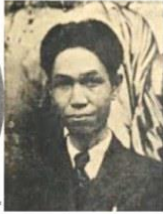
Tạ Thu Thâu