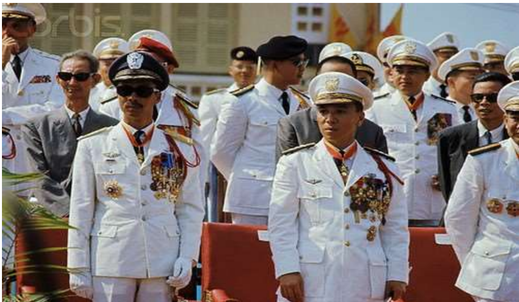
Tổng thống Nguyễn Văn Thiệu khi còn là trung tướng (phải).

Sau đó Tổng thống nhắc lại 4 điểm phản đối chính, đó là: (1) Sự hiện diện của quân Bắc Việt tại Miền Nam. (2) Vai trò của Hội đồng hòa giải được xem như là một chính phủ. (3) Vùng phi quân sự tại vĩ tuyến 17 không được tôn trọng theo như hiệp định Geneve. (4) Hiện nay tại Đông Dương có tới 4 quốc gia chứ không phải chỉ có 3.