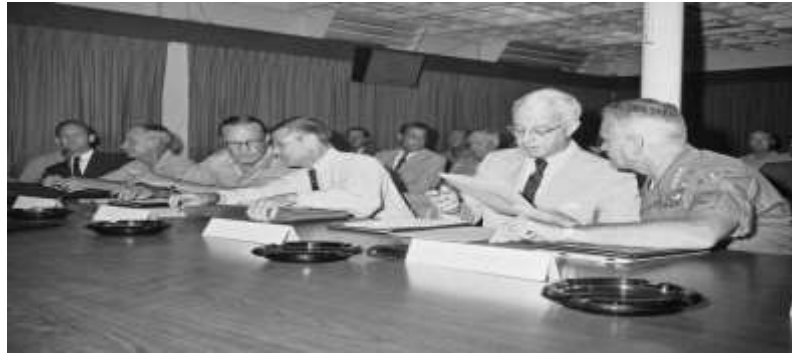
Đại sứ Ellsworth Bunker (thứ hai, phải) đang trao đổi với Đại tướng William C. Westmoreland.

Tổng thống Thiệu lập tức mời một số nhân vật chính trong chính phủ họp bàn về sự phản bội của Hoa Kỳ và tìm cách đối đầu với Kissinger trong chuyến viếng thăm sắp tới của ông ta.