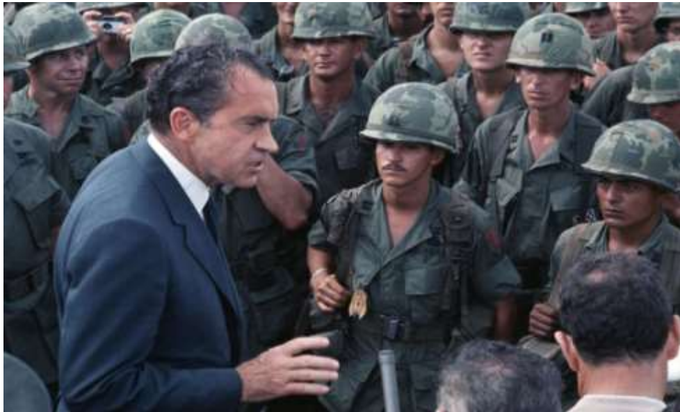
Tổng thống Richard Nixon qua Việt Nam ủy lạo binh sĩ tham chiến.