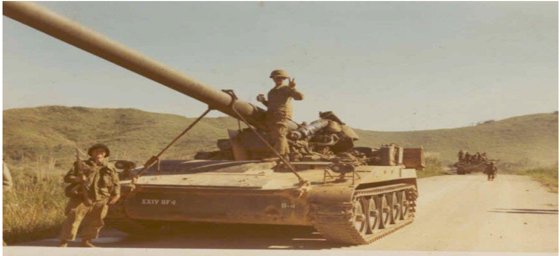
Feb '71 – Convoy to Lam Son 719 along Highway 9