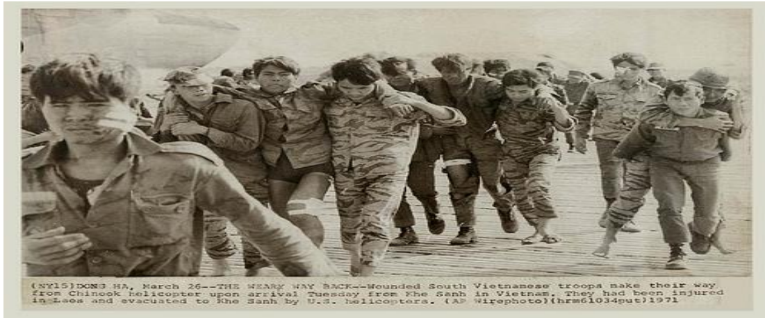
(NY15)DONG HA, March 26--THE WEARY WAY BACK--Wounded South Vietnamese troops make their way from Chinook helicopter upon arrival Tuesday from Khe Sanh in Vietnam. They had been injured in Laos and evacuated to Khe Sanh by U.S. helicopters. (hrs61034put)1971