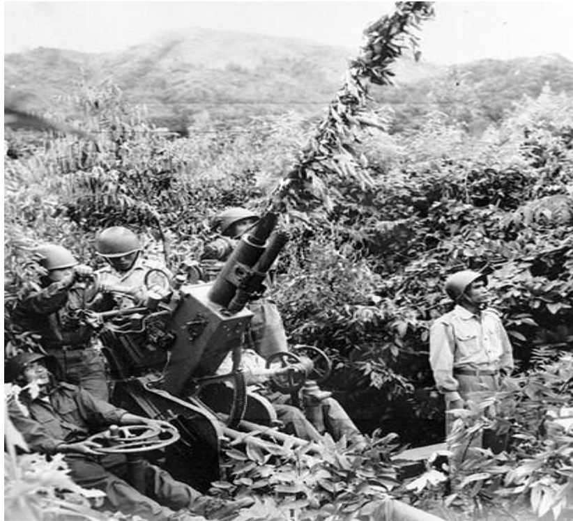
Trận địa phòng không của quân BV

Các đơn vị của ta kể cả những đơn vị phải nhảy ra Bắc Việt Nam, những đơn vị nhảy vùng biên giới, hay những toán Viễn Thám có bao giờ lại hèn kém như vậy; khi chích thuốc này quả thật có liều lĩnh nhưng không còn sáng suốt, nên các toán đặc công cảm tử của chúng hoàn toàn thất bại, khi phải đương đầu với các đơn vị được huấn luyện thuần thục .