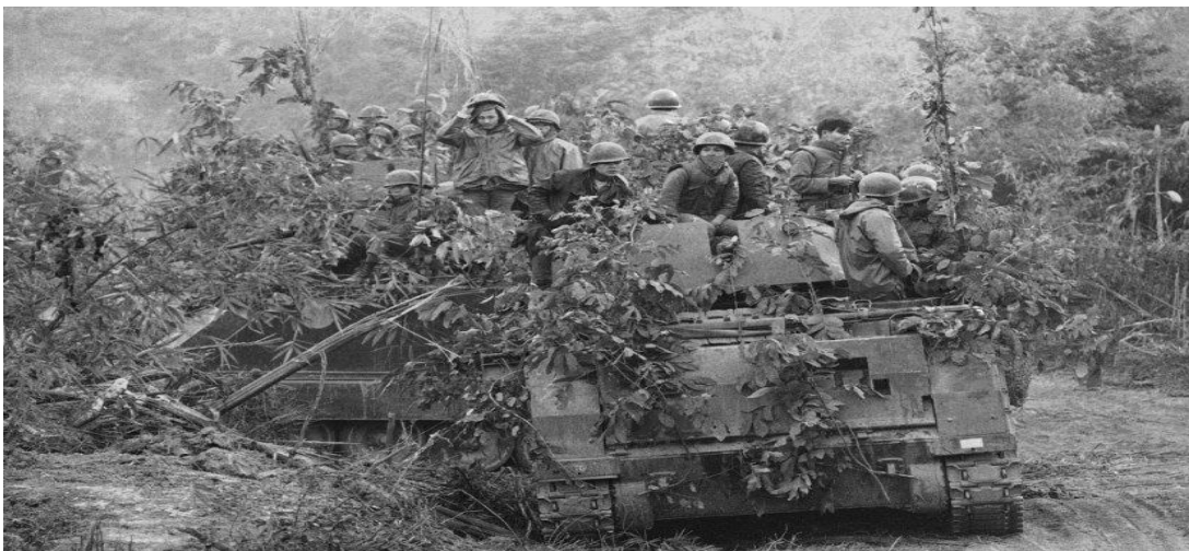
South Vietnamese armored personnel carrier, loaded with airborne troops, moves along Route 9 at Lang Vei, south Vietnam on Feb. 1971