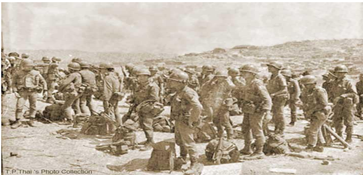
Soldiers of 1st ARVN Infantry Division waiting at Khe Sanh to be airlift into Laos

Máu của chúng tôi đã đổ tại đất đai miền nam của vương quốc Lào, thịt xương của bạn bè chúng tôi không vun trồng cho màu mỡ quê mẹ mà lại làm tươi tốt cho đồng cỏ xứ người, đó chính là niềm đau xót xa, niềm đau day dứt, cho những người lính chiến như chúng tôi; nhưng cái đau xót thấm thía, đau lâu dài hơn là khi Hạ Lào bị cơ quan truyền thông ngoại quốc che mờ bằng màn khói bại trận gớm giếc, khinh bỉ ; cái giá xương máu này lại được tô son chuốt lục bởi các phóng viên Việt Nam, bởi những người bạn của chúng ta, họ tô đậm bằng màu tang trắng thê lương ngay trên quê hương của chúng ta; những mảnh khăn tang