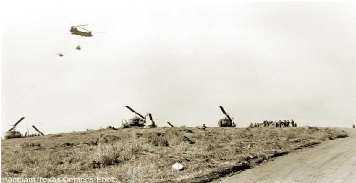
airlift of logistic support to ARVN units in Lam Son 719

mỗi dàn phóng có từ 5 cho đến 7 nòng, lần đầu tiên trong đời chúng tôi các chiến binh Mũ Đỏ được thưởng thức pháo bằng Hỏa Tiễn TOT (time on target) từng chùm như vậy, mỗi lần tới trên 100 trái thật tung bừng, chắc chắn các đơn vị khác của chúng ta chưa được thưởng thức món này, Đ/T Lưỡng đứng ngay bên cạnh tôi để nghe trình bày về các điểm địa hình quân sự, ông bị thương ngay lần pháo này, cũng may điểm nổ gần nhất của trái đạn hỏa tiễn, cách chỗ chúng tôi đứng 20 thước, đến 19:00G ngày N cộng 1, Lữ Đoàn nhận được báo cáo tổng quát như sau, các tin tức này cũng là để minh xác là Hạ Lào có kho tàng của địch hay không .