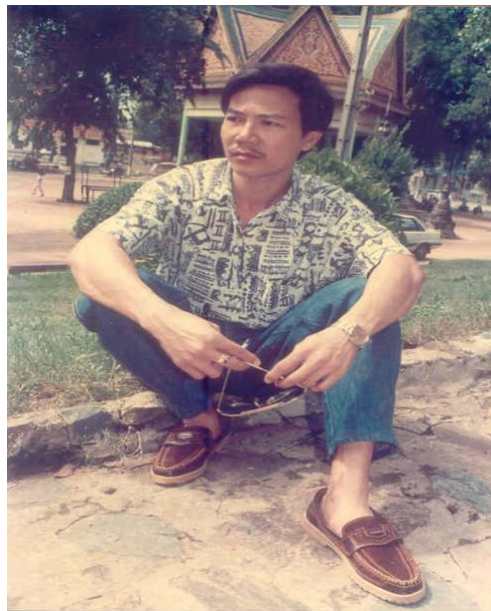
Năm 1.993 khi đến Phnom Penh – Cam Bốt lần thứ hai.