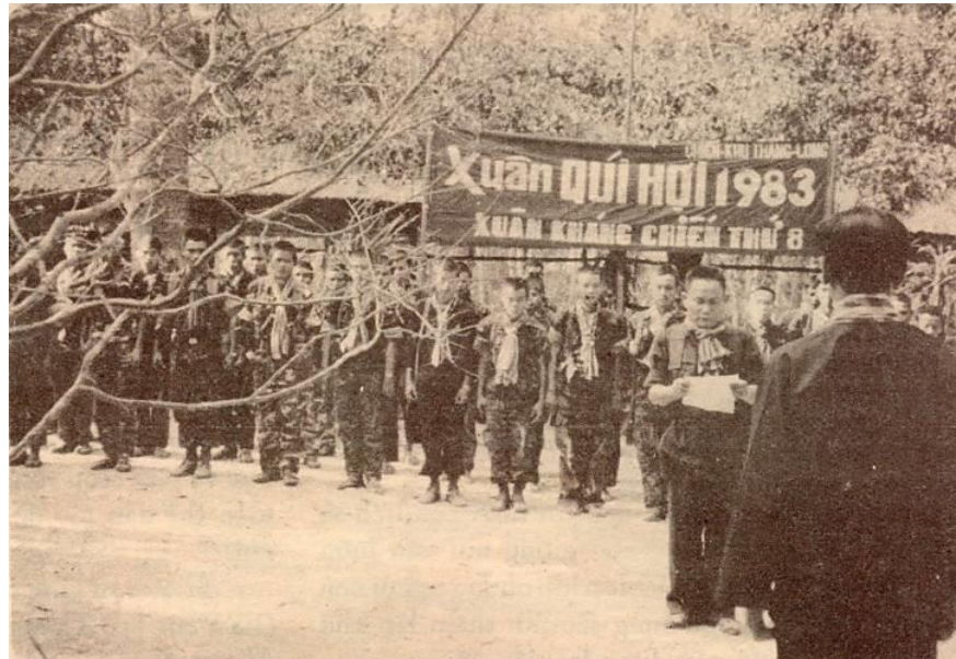
Lãnh đạo MT và các kháng chiến quân đón Tết năm 1.983 trong rừng già khu chiến.