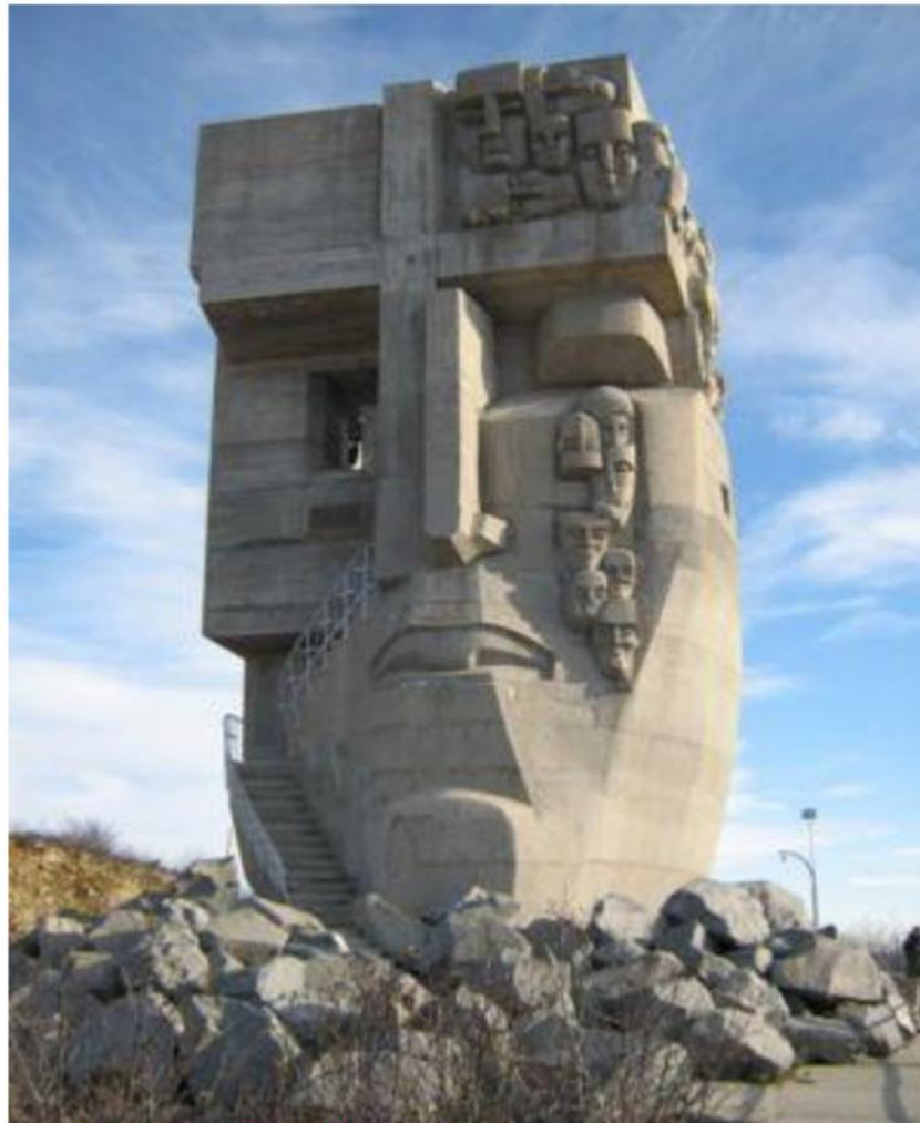
TƯỢNG ĐÁ BỨC MẶT NẠ ĐAU THƯƠNG.