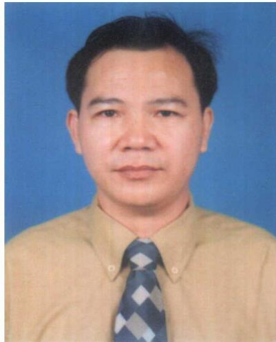
Năm 2.005, thời gian từ Cam Bốt làm thông tin viên cho các đài phát thanh quốc tế.