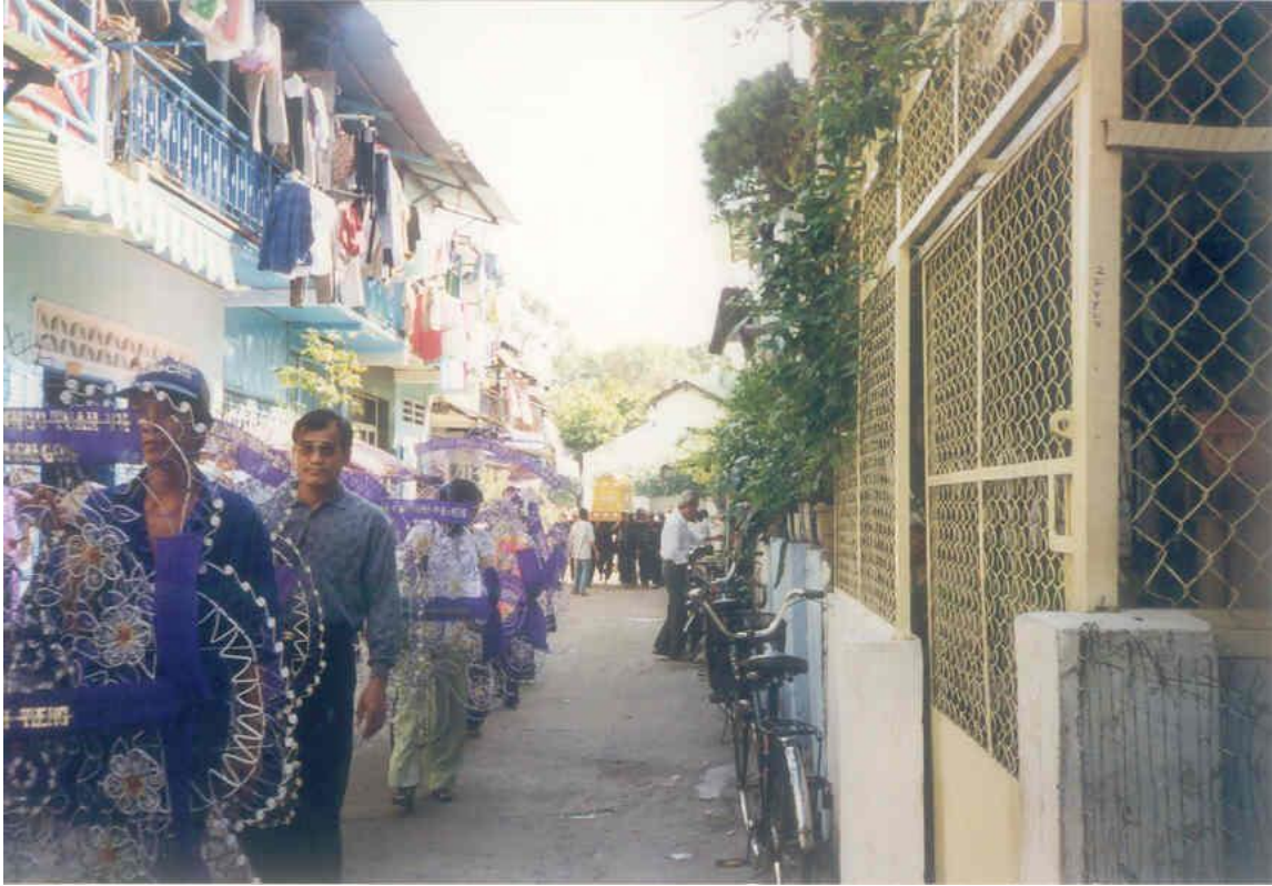
Lễ đưa quan tài Thân Mẫu rời khỏi căn nhà rất thân yêu, lối đi trong xóm nhỏ ngày xưa bao kỷ niệm êm đềm thời thơ ấu nhiều ước mơ.