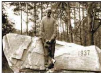
Bức Tượng Tử Nhân Được Đặt Bên Cạnh Xa Lộ Chernihiv Trước Lối Vào Khu Rừng Bykivnia Địa Điểm Đã Xảy Ra Vụ Thảm Sát Hơn 100.000 Người Ukraine Theo Lệnh Stalin.