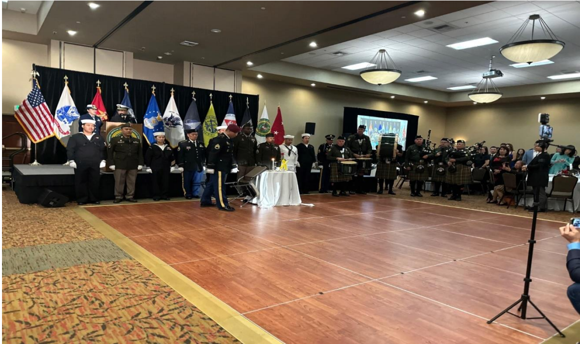
Chiến sĩ người Mỹ gốc Việt tưởng niệm những anh hùng đã hy sinh.