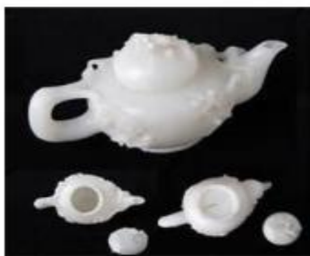
Đồ trà ngọc