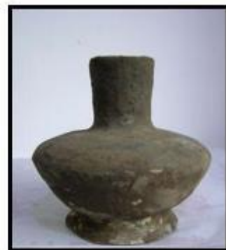
Bình gốm đen