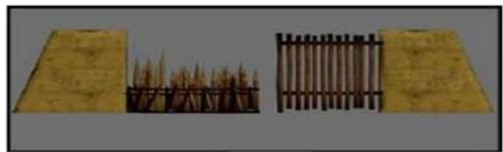
Sơ đồ thành cổ