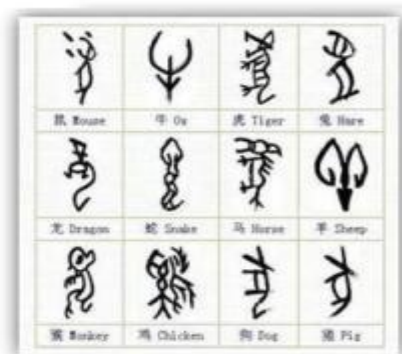
Văn tự Lương Chủ