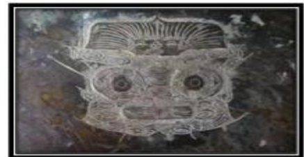
Hình tượng Si Vu đầu rồng