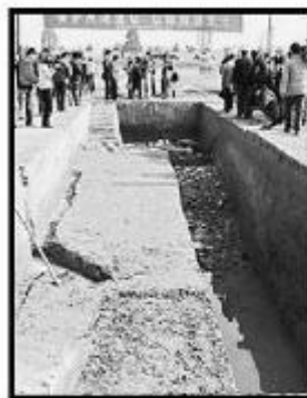
Di tích thành cổ

Sau khi Si Vưu bị vương triều Hoàng Đế đánh bại, văn hóa Liangzhu bước vào thời kỳ suy thoái. Truyền thuyết nói một vài bộ lạc liên minh với Si Vưu gồm nhóm Đông Di, Sơn Đông và các bộ lạc sống trong lưu vực sông Dương Tử. Tù trưởng bộ tộc Si Vưu có một liên minh bộ lạc lớn được gọi là Cửu Lê, phạm vi của nó bao gồm tất cả các nền văn hóa Liangzhu bản địa, người Lê Liangzhu mạnh mẽ nên đứng đầu Cửu Lê. Trong Cửu Lê có một chi gọi là Vũ nhân hoặc Vũ dân. Họ suy tôn chim, thú, làm tổ tiên, và do đức tin đó, thờ phượng chim, thú. Theo mô hình bí ẩn trên nền văn hóa ngọc bích Liangzhu, con chim con thú, là vật tổ của người Liangzhu. Vì vậy, rất có thể người Liangzhu là