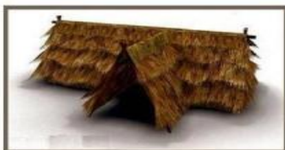
Nhà lá phục chế