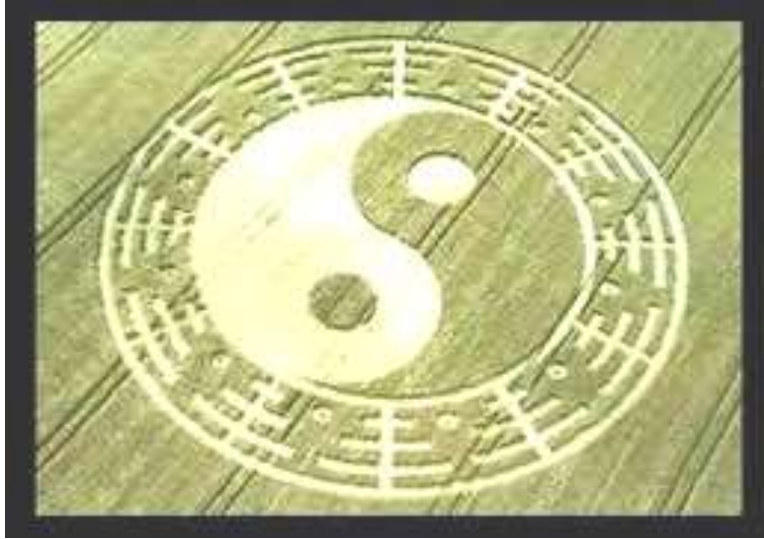
Hình ảnh có ký hiệu Âm Dương do người hành tinh tạo ra trên các đám lúa

Một năm có 12 tháng với 12 con trăng là hình ảnh liên quan đến Thời Gian. Như vậy, Hình ảnh thứ nhất này trên đám lúa cũng nhằm mục đích diễn tả những thứ có liên quan đến Thời Gian.