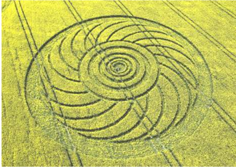
Hình ảnh vật đang quay.hay thiên hà đang quay

Hình ảnh thứ nhì này có thể có nghĩa giống hình ảnh thứ nhất là một vật đang quay. Các vòng tròn bên trong diễn tả vật quay, các răng cưa bên ngoài các vòng tròn đó diễn tả động thái quay của vật đó đang quay theo chiều ngược chiều kim đồng hồ, bên ngoài vật quay là một Vùng Thời Gian do lực quay của vật quay tạo ra để bảo vệ vật quay nằm bên trong Vùng Thời Gian do nó tạo ra.