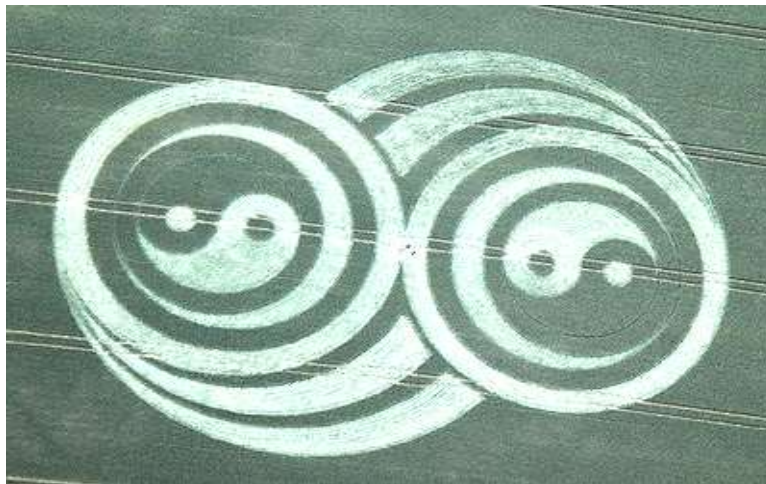
Hình ảnh diễn tả du hành qua về hai Vùng Thời Gian khác nhau.

Hình ảnh hai ký hiệu Âm Dương trên đám lúa là hình ảnh của hai vật quay quay ngược chiều nhau nên tạo ra hai Vùng Thời Gian khác nhau (Thời Gian ở không gian 3 chiều và Chiều Thứ Tư ).