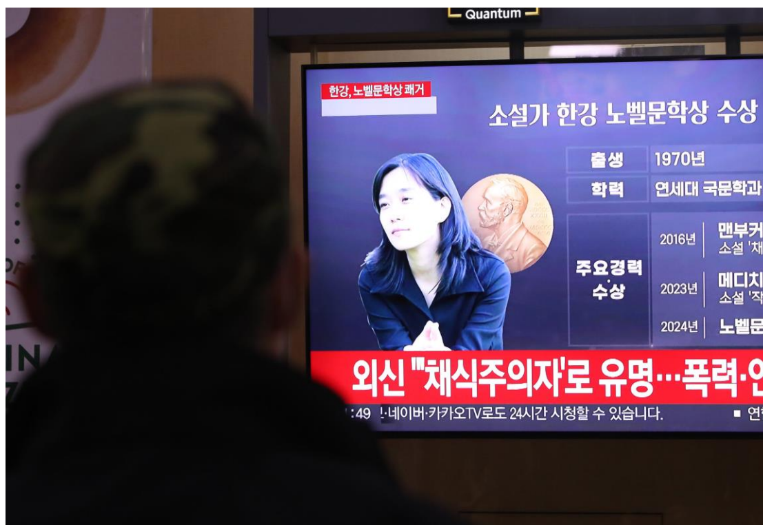
Một màn hình TV ở trạm xe điện chiếu hình văn sĩ Han Kang, người đoạt giải Nobel Văn Chương 2024, tại Seoul, Nam Hàn, ngày 10 Tháng Mười, 2024

một phụ nữ trẻ sống trong một cuộc đời “chay tịnh” sau khi gánh chịu những cơn ác mộng ám ảnh về thói tàn ác của con người.