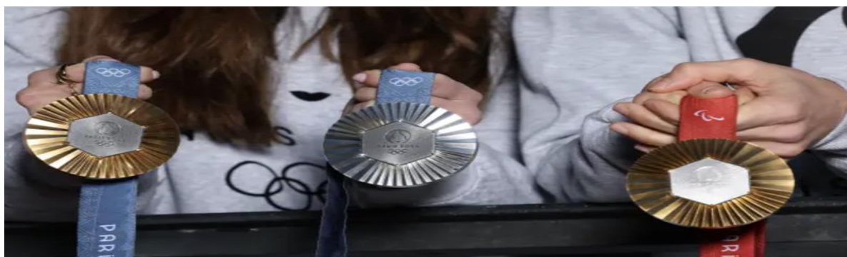
Ảnh minh họa - Ảnh: Getty/CNBC.