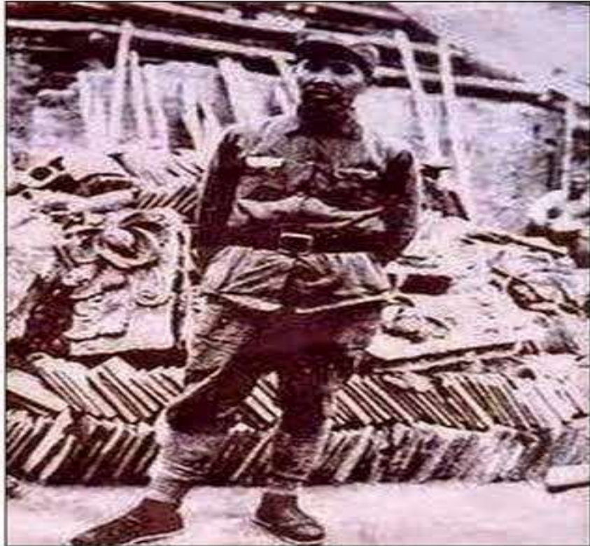
Major Ho Chi Minh - Chinese People's Liberation Army