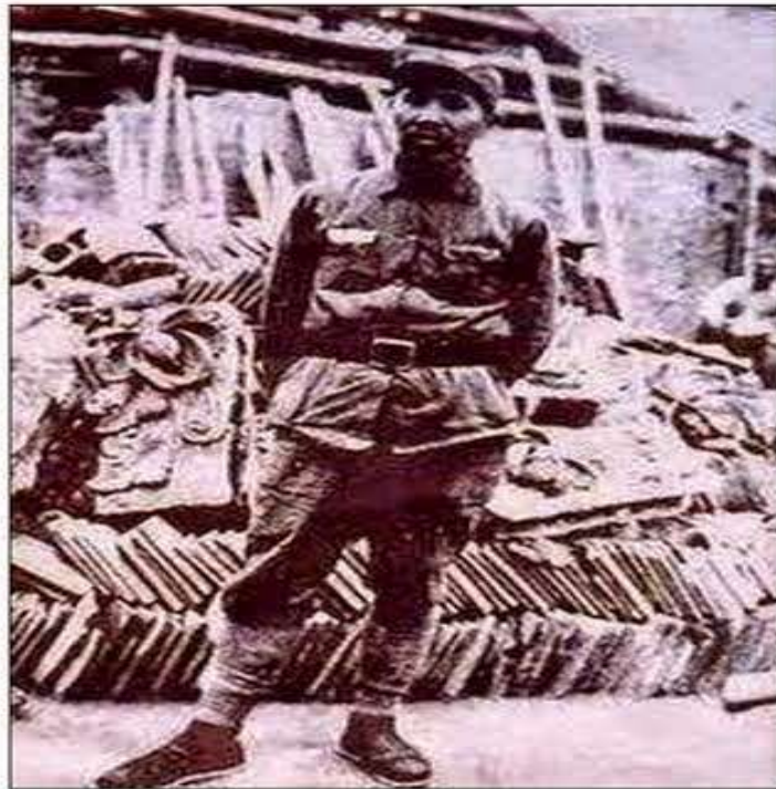
Major Ho Chi Minh - Chinese People's Liberation Army 主要胡志明 - 解放军

Sự việc là thế, nhưng vẫn có người ra diên thành đại ca tụng, đánh bóng ông ta như là “cha già của dân tộc”. thay vì lên án Y là kẻ diệt chủng tộc Việt. Rồi lại có nhiều kẻ u mê, mất trí ra công ra sức đánh bóng sự gian dối vô đạo của Y bằng thứ ngôn ngữ buồn nôn, rồi tuyên truyền đầu độc giới trẻ “học tập theo gương đạo đức của bác Hồ”, mà không hề biết bản thân Y là một kẻ vô đạo, bất nhân, bất hiếu, bất nghĩa. Đã thế, còn bày đoàn xây đài, đúc tượng cho y. Tìm đủ mọi phương cách để chèn ép, bức hại các tôn giáo để đưa cái đầu lâu của y vào chùa, vào đền miếu ngang hàng với thần phật, mà không hề biết rằng bản thân y, một đảng viên đảng cộng sản thì cho đến chết vẫn là một kẻ tôn thờ chủ nghĩa tam vô. Vô thần phật, không cúng kiếng! Theo đó, việc đốt nhang đền cho y, cho một đảng viên cộng sản, tưởng là chuyện hay, chuyện tốt, giúp họ thoát chốn đọa đày, trầm luân và sớm được quay về với thần thánh nơi miền