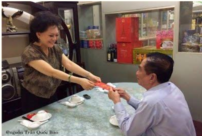
Ca sĩ Giao Linh mừng tuổi thầy Nguyễn Văn Đông ngày mừng 3 Tết Ất Mùi 2015