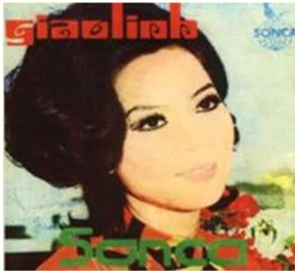
Bìa đĩa nhạc Giao Linh của hãng đĩa Sơn Ca

– Với Giao Linh có nhiều kỷ niệm khó quên. Tôi nhớ lại, vào một sáng Chúa Nhật năm 1965, nhạc sĩ Thu Hồ đưa đến nhà tôi một cô bé gầy gò ốm yếu. Cô đến bằng chiếc xe máy mini Velo Solex, nhưng không đủ sức đẩy xe qua thềm nhà tôi, phải nhờ nhạc sĩ Thu Hồ giúp đỡ.