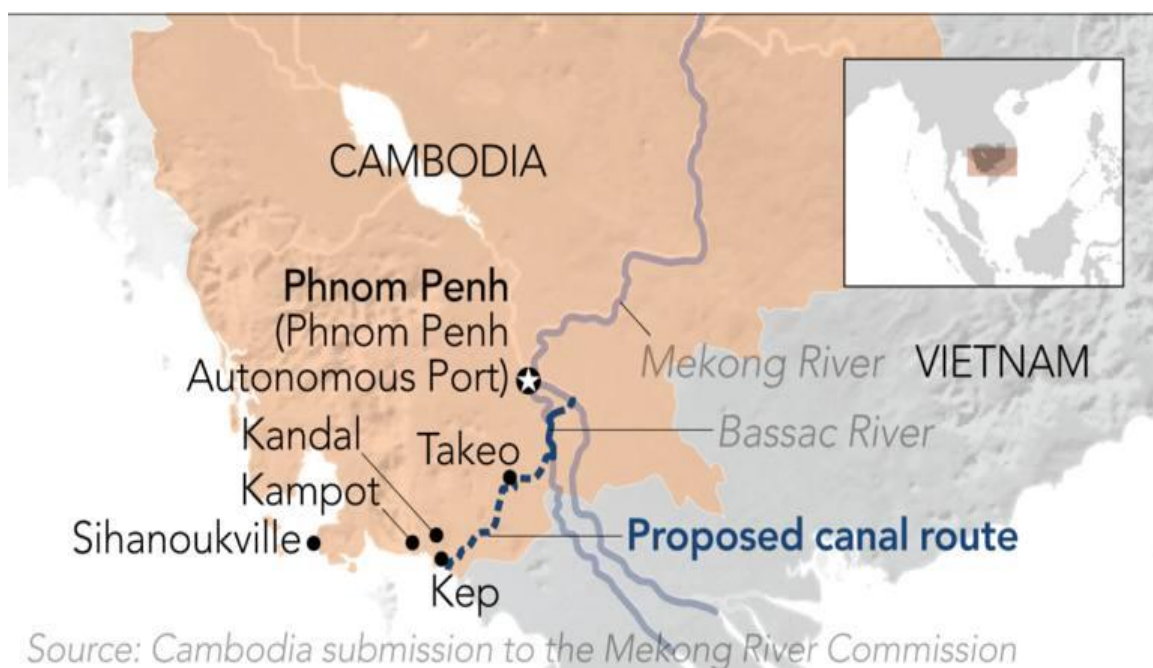
Vị trí dự kiến của Kênh đào Phù Nam tại Campuchia.

Tranh cãi xoay quanh kênh đào này cũng phản ánh những căng thẳng địa chính trị sâu sắc hơn khi Campuchia cố gắng thoát khỏi sự phụ thuộc vào các tuyến thương mại do Việt Nam kiểm soát, làm suy yếu đòn bẩy khu vực của Hà Nội, đồng thời nâng cao hơn nữa ảnh hưởng của Bắc Kinh ở phía nam sông Mekong.