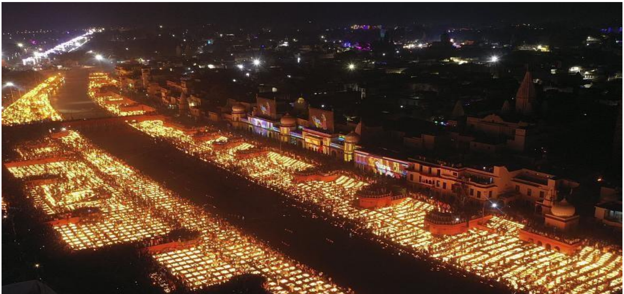
"Dòng sông" ánh sáng trên bờ sông Saryu ở Ayodhya, Ấn Độ ngày 3/11/2021.

Lễ hội Ánh sáng Diwali là lễ hội có ý nghĩa quan trọng nhất trong năm đối với người theo đạo Hindu nói chung và với Ấn Độ nói riêng. Do người theo đạo Hindu chiếm khoảng 80% trong tổng dân số 1,4 tỷ người ở Ấn Độ nên Diwali được tổ chức linh đình trên cả nước.