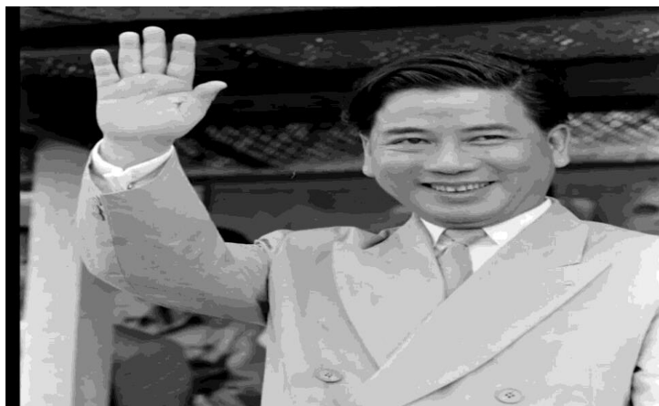
Tổng thống Ngô Đình Diệm

đổi ý vào giờ chót và ở lại Sài Gòn, cho nên các tướng lãnh đã tiếp tục đảo chính. Sự việc này cho ta một bài học: hành động của đại sứ Mỹ có mặt tại chỗ là hết sức quan trọng.