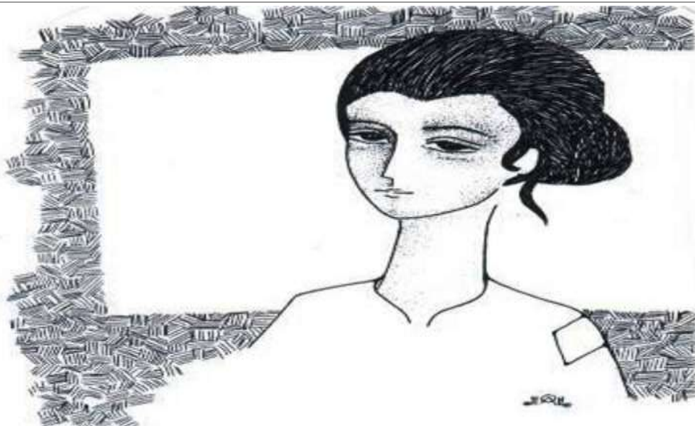
Tranh vẽ - Duy Hân.