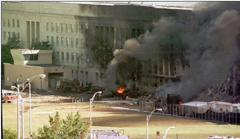
Trụ sở Ngũ Giác Đài bị khủng bố tấn công ngày 11 tháng 9, 2001.

Nó là con gái, sinh năm 1968 tại Việt Nam. Ba Mỹ. Má Việt. Và trước sau nó chỉ có một mình, không có thêm anh em nào nữa.