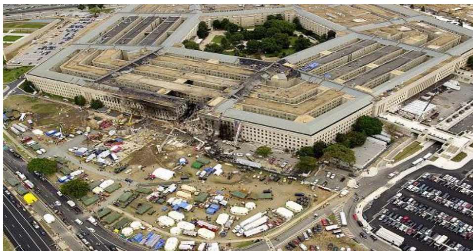
Trụ sở Ngũ Giác Đài bị khủng bố tấn công ngày 11 tháng 9, 2001.

Có lần bà tỉnh lại và tâm sự với mẹ của Mì Tô rằng kể từ ngày bà mất chồng con, chưa có ai đưa cho bà thức ăn với tất cả trân trọng và thương yêu như Mì Tô đã làm. Cũng chưa có ai nhìn bà với ánh mắt như Mì Tô đã nhìn.