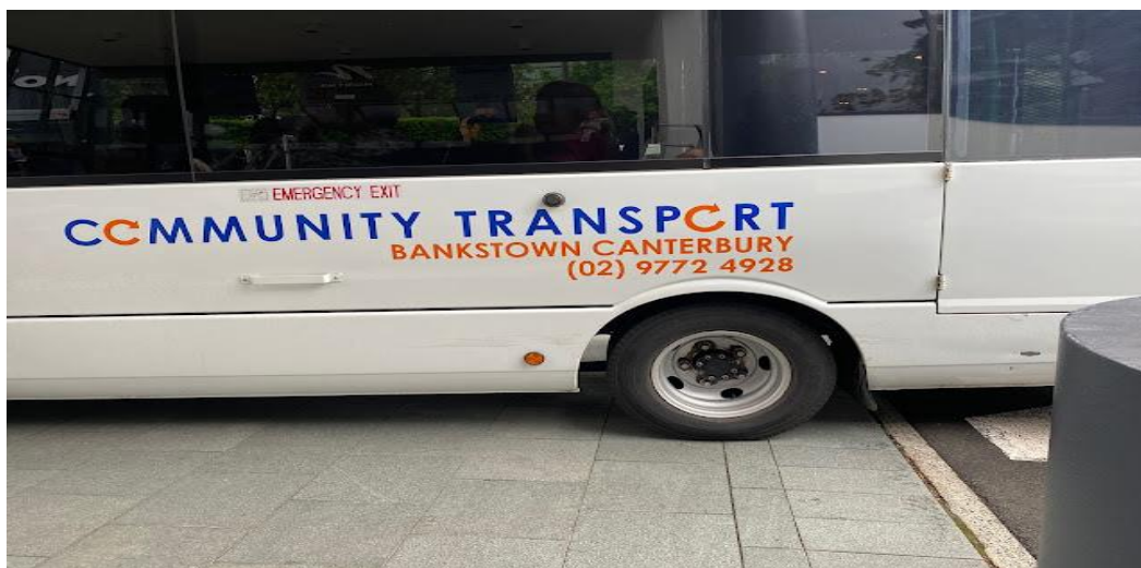
Xe bus cộng đồng

Xe bus đi tới từng nhà rước người, chạy lòng vòng trong thành phố rước 15 người mất gần hai tiếng đồng hồ mới đi tới nơi. Con đường hoa này đẹp có tiếng nhưng tiếc thay trước đây vài ngày, Sydney bị một cơn mưa khá lớn làm tàn tạ một số hoa trên cành, mất đi vẻ đẹp vốn có.