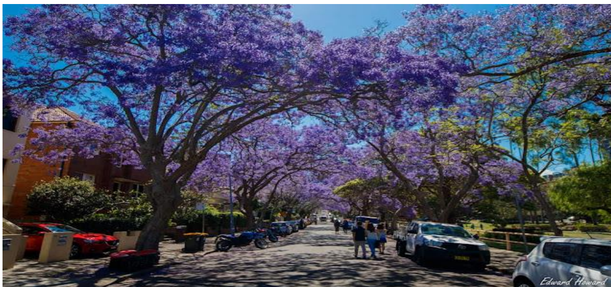
Jacaranda in Kirribilli, Sydney

Mỗi năm, từ cuối tháng mười đến tháng mười một là mùa của phượng tím Jacaranda ở Úc châu. Chung quanh Sydney, con đường nào cũng thấy rải rác vài cây phượng tím vươn lên bầu trời trong xanh, màu hoa tím tím như sương như khói mờ màng phủ lên thành phố một vẻ đẹp vừa thơ mộng, vừa liêu trai.