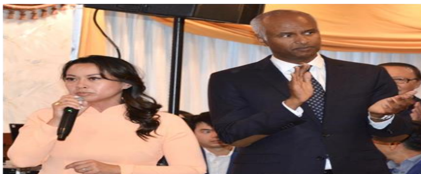
Bà Rechie Valdez và ông Ahmed Hussen