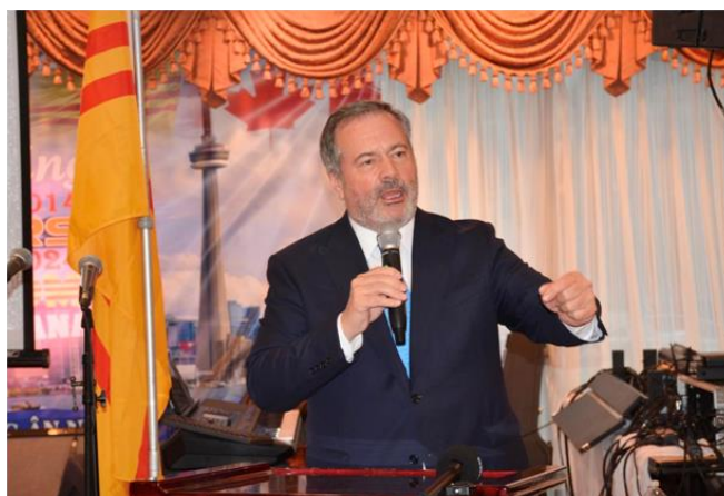
Ông Jason Kenny đang phát biểu

Ban tổ chức cũng đã gửi tặng đến quý vị quan khách một số quà kỷ niệm được đan thêu và dệt bằng tay do chính đồng bào tị nạn VN tại Thái Lan gửi tặng, một số còn lại được đem bán để gây quỹ mua gạo cho đồng bào. Số tiền góp được ngay trong đêm hôm đó đã lên đến gần 5000 đô la, tất cả sẽ được gửi trực tiếp về Thái Lan để mua gạo giúp đồng bào sống qua ngày. Tưởng cũng nên nhắc lại rằng, hàng tháng Phong Trào Việt Hưng cùng một vị ân nhân tại Houston vẫn đều đặn chuyển 3000 US đô la để mua gạo phát cho đồng bào cứ hai tháng một lần.