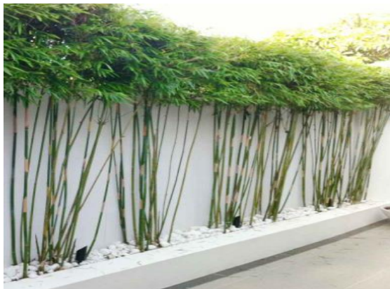
Tre trồng trong học xi-măng

Mỗi năm trường Trung học “Phanh Thanh Giản & Đoàn Thị Điểm” đều tổ chức Đại hội cựu học sinh trường. Năm nay ở Florida, vùng biển đẹp có nắng ấm nổi tiếng đó đây. Chúng tôi (những người dự đại hội của trường) được đi giãn ngoại thăm vườn trồng cây ăn trái, loại trái thường thấy ở miền Hậu Giang miền Nam nước Việt.