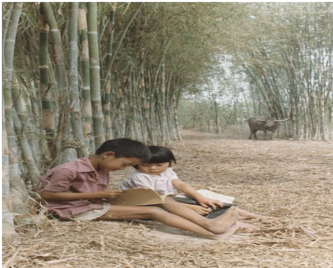
“Thời Niên Thiếu” Nhiếp ảnh gia Lê Quang Xuân