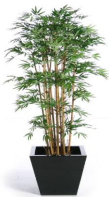
Tre trồng trong chậu

Theo thiên nghĩ của cá nhân, ở nơi có đất nhà ít (không rộng) chúng ta trồng tre làm kiếng, thì trồng trong chậu là tốt nhất. Nếu muốn trồng xuống đất thì phải làm những cái học dày bằng xi-măng để trồng tre, như thế mới giữ cho rễ không mọc ra ngoài ăn lân mấy cây khác.