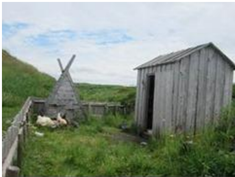
Chường gia súc.