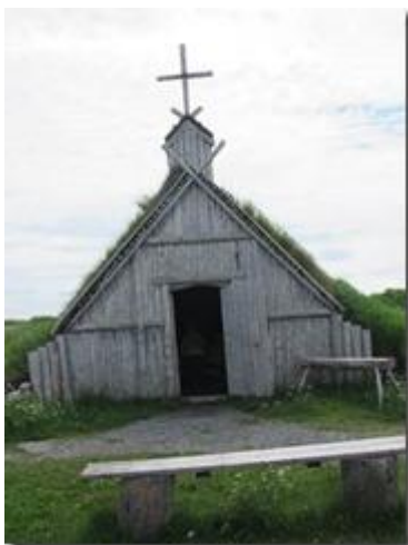
Nhà thờ.