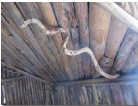
Vật tổ Rấn.

Dĩ nhiên Nhà Lang có đủ ý nghĩa, chức vụ như một nhà đình Việt Nam và bên trong có trang hoàng các vật tổ, các biểu tượng văn hóa Viking.