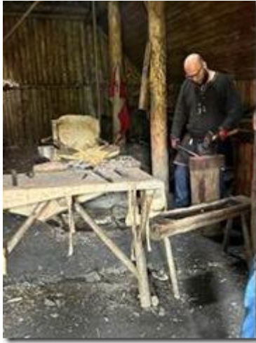
Lò rèn.