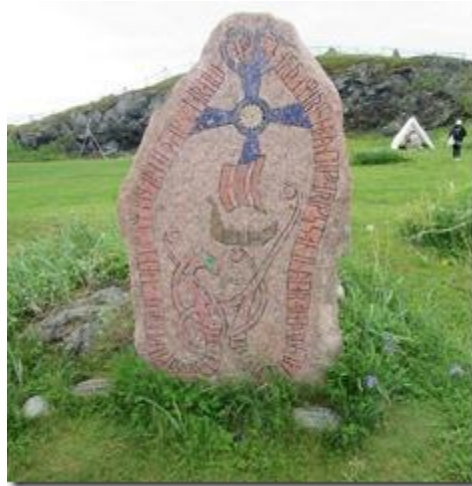
Tấm bia ở sân làng.

Viền quanh bia là hình con rắn vật tổ của Viking. Xin nhắc lại Viking có nghĩa là “Người ở Vịnh, ở Vũng Biển”. Họ thuộc tộc Nước trong vũ trụ giáo giống như Lạc Việt vì vậy họ có vật tổ là con Rắn Nước về sau thần thoại hóa thành Rồng (nên họ có thuyền gọi là thuyền rồng) giống như Lạc Việt Lạc Long Quân có vật tổ là Rắn Nước rồi thần thoại hóa thành Rồng, thành Long.