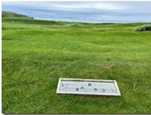
Di tích một tòa nhà Viking (ảnh của tác giả).

Nhưng buồn thay trước mắt chỉ thấy lờ mờ như những mảnh ruộng mọc đầy cỏ xanh sau những cơn mưa như sáng nay!