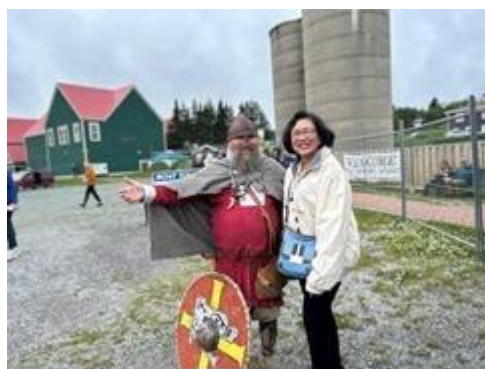
Một Viking chào mừng du khách tới bến cảng St Anthony.

Lưu ý người Viking thú thật, chân thật không đội mũ có sừng, không phải là thú ”sừng sỏ”. Viking đầu sừng là Viking “ròm” lấy theo kịch bản Opera ở Broadway, New York.