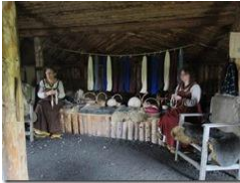
Nhà dệt may mặc (ảnh của tác giả).