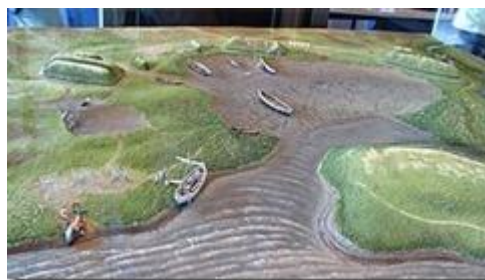
Mô hình định cư của người Norse ở 'Anse aux Meadows.

Tiếp tục, lối đi quanh co dẫn tới khu định cư Viking Anse aux Meadows gồm cả vùng biển và đất liền: