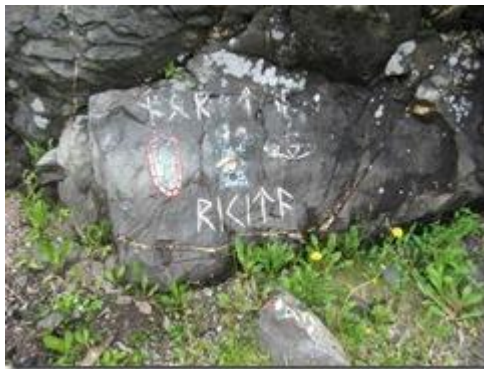
Hàng dưới cùng đọc là Ricita.