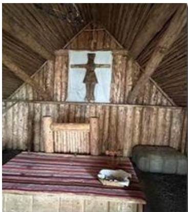
Bên trong nhà thờ.