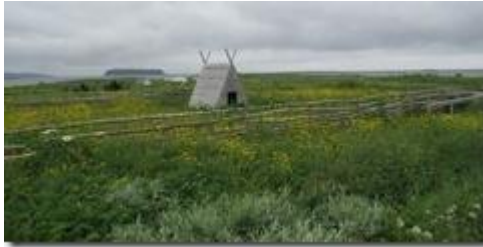
Nhà vườn và nhà 'đi đồng'?