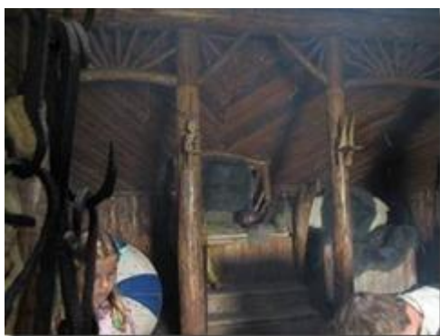
'Ngai' của trưởng làng.