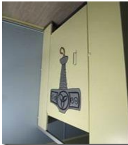
Phòng vệ sinh nam.

Đổi ngược với khiên nòng âm là búa rìu Thiên Lôi Thor nọc, dương thấy ngay trong phòng vệ sinh nam ở đây: