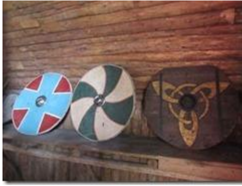
Khiên Viking.

Các khiên Viking điển đạt văn hóa Viking. Chiếc bên trái điển đạt vũ trụ tạo sinh ở dạng tĩnh với chữ thập đứng yên điển đạt tứ tượng. Chiếc ở giữa điển đạt vũ trụ tạo sinh ở dạng sinh động với chữ thập chuyển động thành hình chong chóng mang tính tứ hành. Chiếc thứ ba bên phải có biểu tượng chong chóng ba cánh quạt có một khuôn mặt điển đạt tam thế.