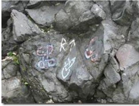
Chữ viết và biểu tượng hình học.

Xin nói một chút về chữ viết của Viking.