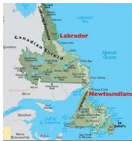
Tỉnh hạt (Province) Newfoundland-Labrador.

Bản đồ cho thấy tàu tuần dương đi từ New York lên Halifax Canada tới Corner Brook, Newfoundland để đến bến cảng St Anthony, Newfoundland, Canada.