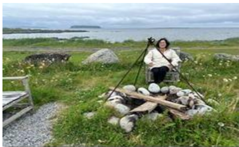
Hố lửa giữa sân làng.

Giữa sân làng có hố lửa, dĩ nhiên mang tính tế lễ vũ trụ trời đất (giống hố lửa ở giữa quần thể tháp Maya) và cũng dùng sưởi ấm ngoài trời.