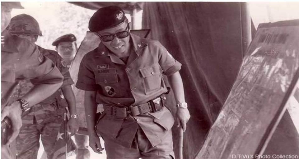
BRIGADIER GENERAL TRAN QUANG KHOI

Sau khi ký-kết Hiệp-Định Paris, đầu năm 1973, Quân-đội Mỹ ở Miền Nam Việt-Nam (MNVN) bắt đầu rút quân về nước. Các đơn-vị chủ-lực của CSVN ở Vùng 3 Chiến-Thuật gồm có 3 Sư-đoàn Bộ-binh: 5, 7, 9 và các đơn-vị đặc-công ém-quân bên kia biên-giới Việt-Miên thường-xuyên xâm-nhập vào lãnh-thổ nước ta quấy-nhiều hoặc bao-vây tấn-công các đồn biên-phòng của chúng ta dọc theo biên-giới ở các tỉnh Hậu-Nghĩa, Tây-Ninh, Bình-Long và Phước-Long. Chủ-lực của Quân-đoàn III gồm có 3 Sư-đoàn Bộ-Binh 5, 18, 25 và Lữ-đoàn 3 Ky-Binh được sự yểm-trợ trực-tiếp của Tiểu-đoàn 46 Pháo-binh 155 ly, Tiểu-đoàn 61 PB 105 ly và Liên-đoàn 30 Công-Binh dưới quyền chỉ-huy của trung-tướng Nguyễn-Văn-Minh, một mặt phải lo dàn mỏng quân ra thay-thế Lực-lượng II Dã-chiến Hoa-Kỳ để bảo-vệ lãnh-thổ chống lại chủ-trương “dành dân lấn đất” của Cộng-Sản sau khi Hiệp-Định Paris ra đời; mặt khác, trung-tướng Nguyễn-Văn-Minh, tư-lệnh Quân-Đoàn III phạm sai lầm rất lớn về tổ-chức và sử-dụng lực-lượng là giải-tán