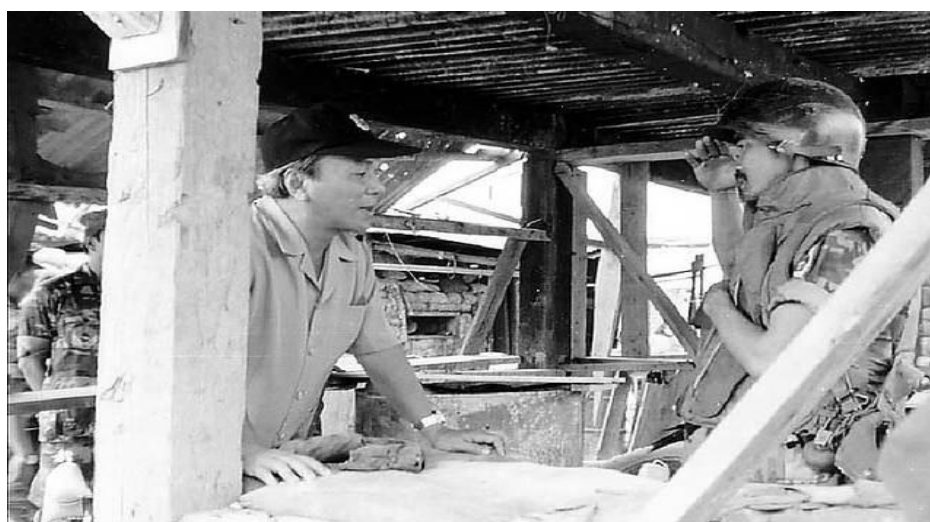
President Nguyen Van Thieu is in a pep talk with a Ranger at Duc Hue Camp