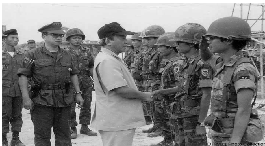
President NGUYEN VAN THIEU visits 83rd Ranger Battalion at DUC HUE camp

Tổng-Thống Nguyễn-Văn-Thiệu đến Gò-Dầu-Hạ quan sát chiến-trường