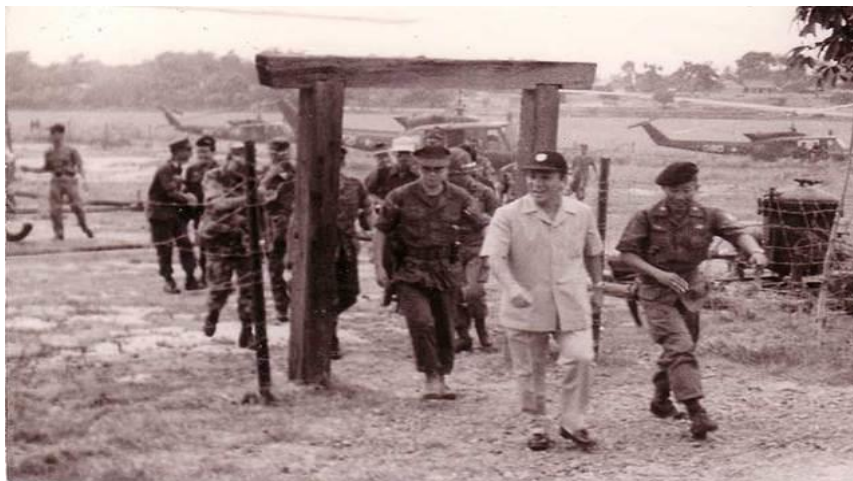
President Nguyen Van Thieu flew to Go Dau Ha to visit the troops after DUC HUE battle

Tổng-Thống Nguyễn-Văn-Thiệu đến Gò-Dầu-Hạ quan sát chiến-trường