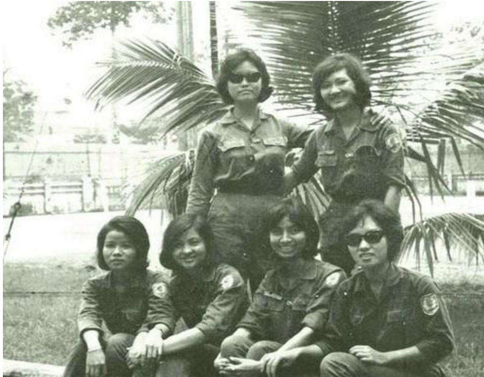
Các nữ SVSQ Học Viện Cảnh Sát Quốc Gia VNCH

Quý chị đã chịu đựng quá nhiều, chỉ vì quyết tâm đóng góp cho một lý tưởng cao đẹp của một dân tộc, quý chị luôn ấp ủ một hoài bão tự do, dân chủ của đất nước trong tim. Hành động của nữ quân nhân là tấm gương sáng cho các thế hệ trẻ hiểu rằng quý chị luôn tiếp nối con đường của các thế hệ trước đã đi để đắp xây sự thành công tốt đẹp cho đất nước. Quý chị chính là những Anh Thư của QLVNCH, là nguyên khí của đất nước, thể hiện tinh hoa của dân tộc.