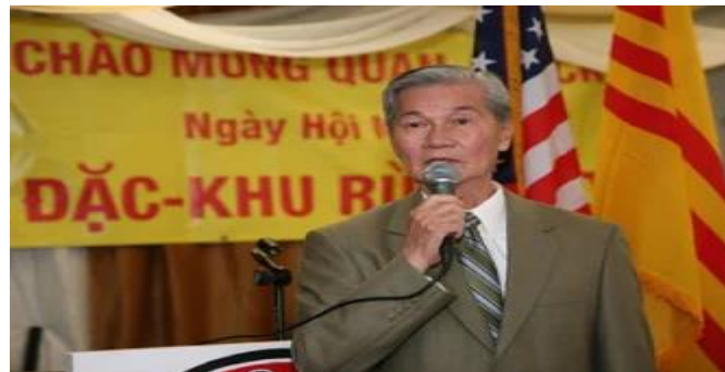
Tác giả: Cổ Tấn Tinh Châu. Nguồn ảnh: báo Người Việt.