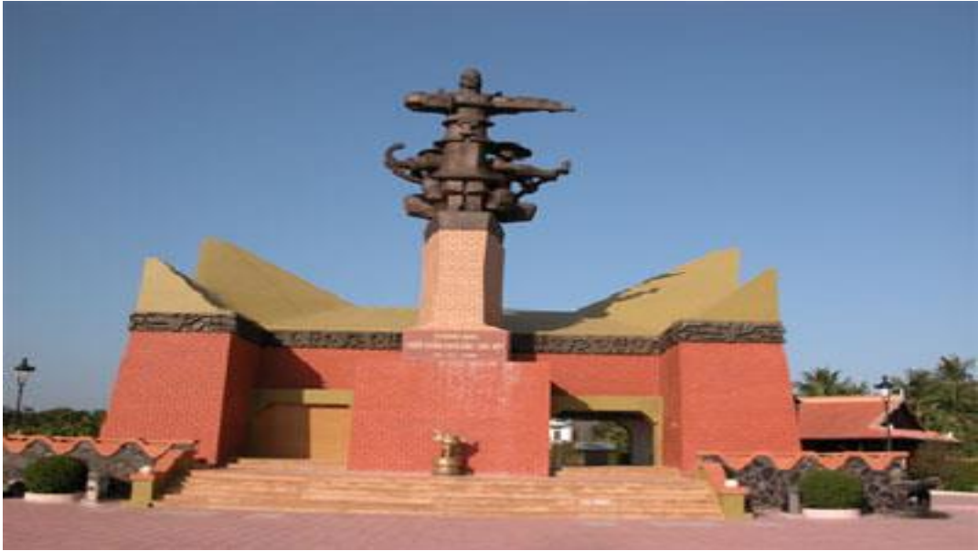
Đài tưởng niệm chiến thắng Rạch Gầm-Xoài Mút tại Mỹ Tho, Tiền Giang.

Những mũi tên công sắc sảo của quân Tây Sơn luôn giáng cho quân địch những đòn chí mạng. Bởi thế, chỉ một trận Rạch Gầm - Xoài Mút mà quân Xiêm sau này "sợ quân Tây Sơn như sợ cọp". Còn nhà Thanh cũng tắt luôn âm mưu xâm lược nước Nam từ trận đại bại đó.