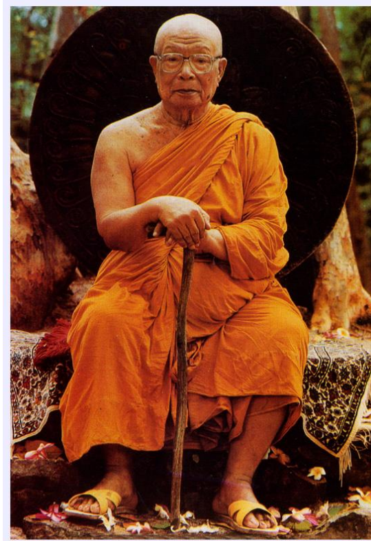
Đại sư Buddhadasa

Quyển sách không nhằm vào chủ đích phân tích những gì trong kinh điển mà đúng hơn là để nhắc nhở chúng ta hãy nên nhìn thẳng vào bản chất của chính mình và của mọi vật thể chung quanh hầu giúp chúng ta biết ứng xử thích nghi hơn với cái bản chất ấy của chúng và để giúp chúng ta trở thành những con người sáng suốt, hoàn hảo và an vui hơn. Bản dịch sang tiếng Việt này được dựa vào ấn bản tiếng Anh của Rod Bucknell và tiếng Pháp của Jeanne Schut trên đây.