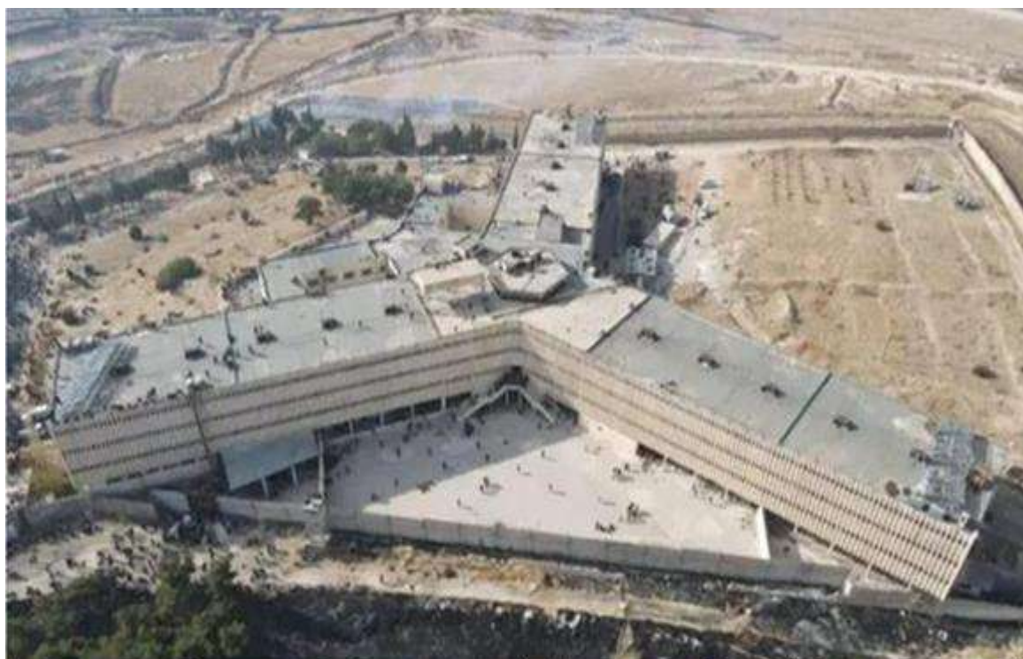
Nhà tù Saydnaya, ảnh chụp ngày 9/12/2024 sau khi chế độ Assad sụp đổ