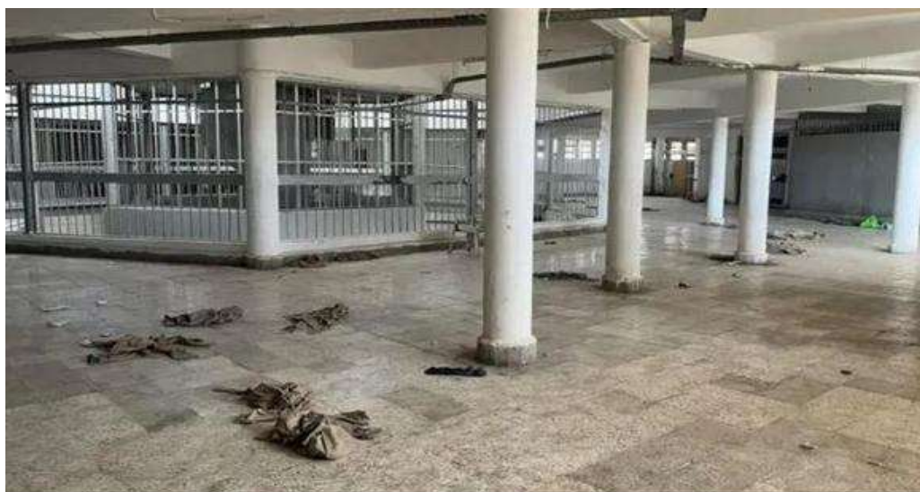
Nhiều bọc thuốc nằm rải rác trên sàn nhà tù

Trong tuần trước, tại một bệnh viện ở Damascus, một quan chức cho biết các cuộc kiểm tra y tế sơ bộ đối với những tù nhân được chuyển tới phát hiện "chủ yếu là các vấn đề tâm lý".