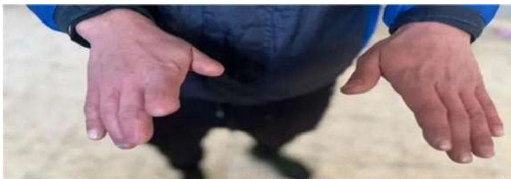
Hướng dẫn viên" của chúng tôi bị chặt mất ngón tay khi chịu tra tấn