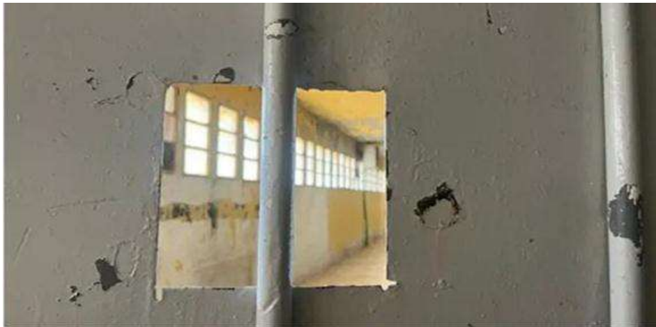
Tự do ở phía bên kia ô cửa

Anh hồi tưởng việc bị lột trường và bắt tạo dáng để chụp ảnh trước khi bị đánh đập vì đã nhìn vào máy ảnh.