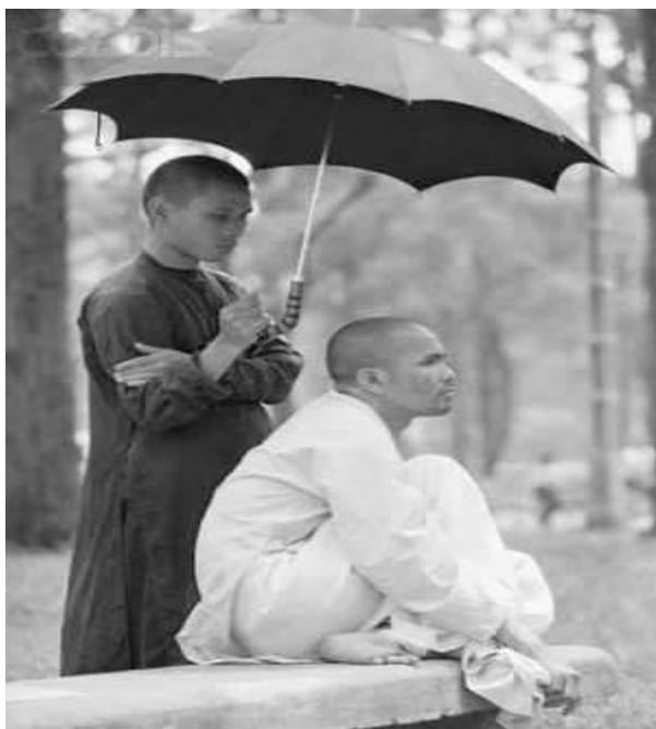
Thích Trí Quang

– Trung Tướng cứ nôn nóng mãi! Chính trị chứ đâu phải quân sự mà cứ đánh ào ào tới là được.