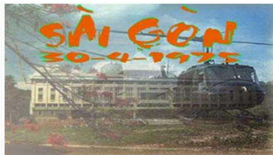
Ngày phán xét những kẻ đã đẩy dân tộc vào cuộc chiến huyết nhục tương tàn.

Tôi chỉ bày tỏ ngần ấy, còn đối với lựa chọn của họ, tôi không có ý kiến. Vì họ đều là những thanh niên trí thức và có lý tưởng nên tôi không ngu dại mất thì giờ để thuyết phục họ. Theo tôi thì tất cả mọi người hoàn toàn tự do trong chọn lựa của mình để đi con đường mà mình muốn đi.