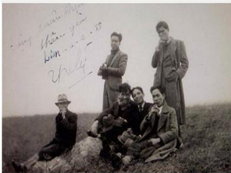
Nhóm Tự Lực Văn Đoàn

trong nhà mất hết niềm hy vọng đã đặt vào chú là chú có thể chữa khỏi bệnh cho bố tôi. Về mặt đau buồn và cặp mắt đỏ hoe của chú đã nói lên được sự sắp sửa ra đi của bố tôi. Cho nên chú chỉ nói một câu tiếng Tây ý nghĩa là bệnh của bố tôi không khỏi được và sự ra đi vĩnh viễn của bố tôi cũng gần đến. Vài giờ sau đó thì bố tôi tắt thở.