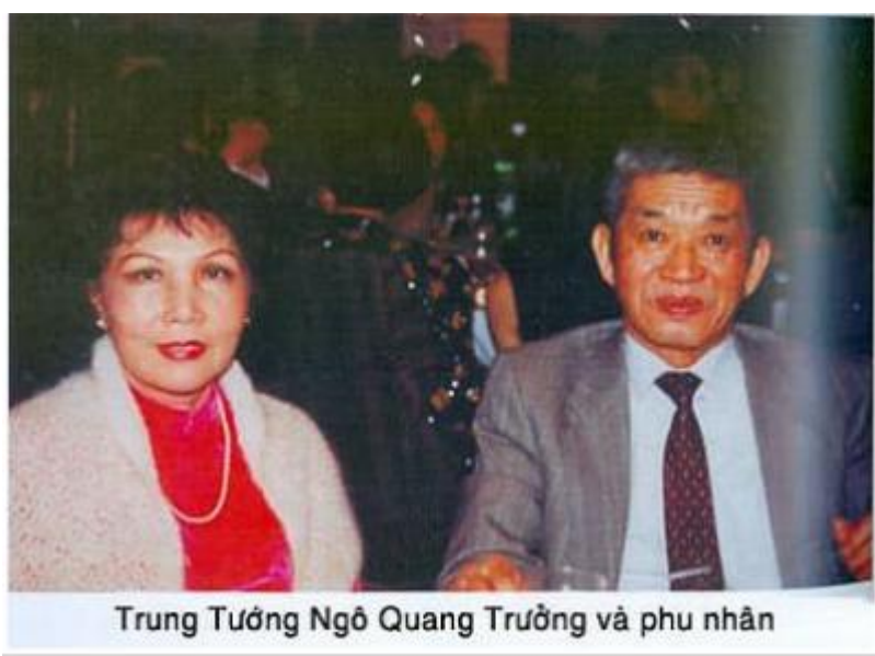
Trung Tướng Ngô Quang Trưởng và phu nhân