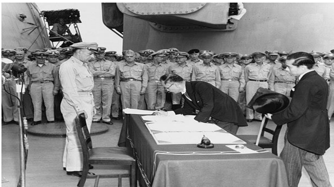
Bộ trưởng Ngoại giao Nhật, Mamoru Shigemitsu, ký văn kiện đầu hàng trên chiến hạm USS Missouri trước sự hiện diện của Tướng Richard K. Sutherland, ngày 2 tháng 9 năm 1945

Ngày 14/8/1945, Nhật Hoàng tuyên bố trên đài phát thanh chấp nhận đầu hàng không điều kiện với các nước Đồng Minh, nhưng đến ngày 2/9/1945, nghi lễ đầu hàng của Nhật trước quân đội Đồng Minh mới được thực hiện trên chiến hạm USS Missouri (BB-63) của Hải quân Hoa Kỳ. Và, từ đó, ở trời Tây, Ý và Đức bị quân đội Đồng Minh phản công mãnh liệt, Đệ Nhị Thế Chiến kết thúc.