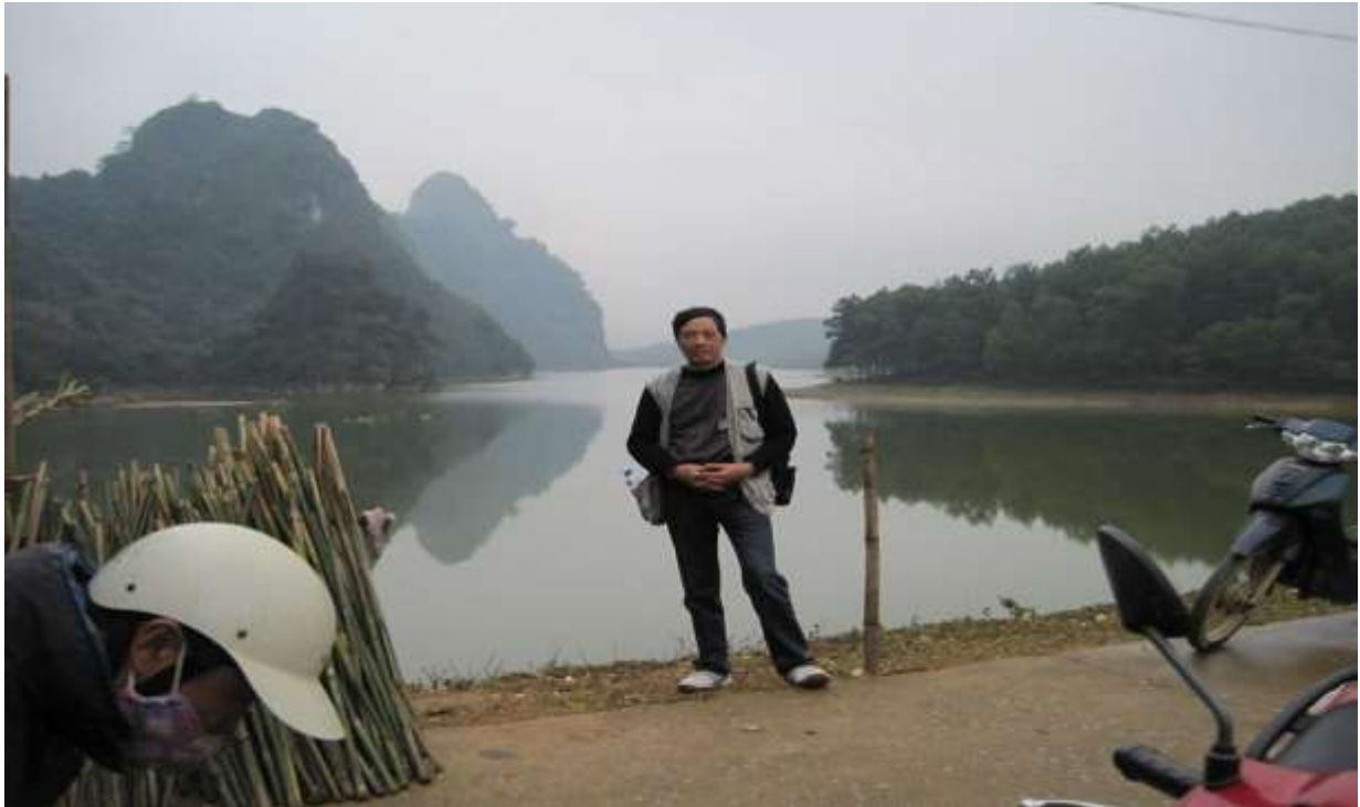
Tác giả trong một chuyến công tác miền núi