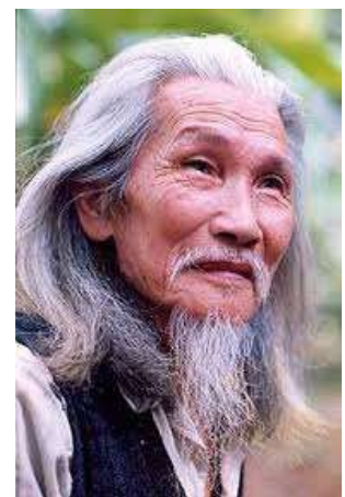
(hình nhà thơ Nguyễn Hữu Loan)

Nhà thơ Nguyễn Hữu Loan , trong một buổi phỏng vấn nhà thơ nổi tiếng với bài "Màu Tím Hoa Sim", Nguyễn Hữu Loan đã đề cập tới tội ác của hồ chí minh, kẻ đã phát động chiến dịch Cải Cách Ruộng Đất theo lệnh của quốc tế cộng sản, đã giết hàng chục ngàn người dân vô tội ở miền Bắc: