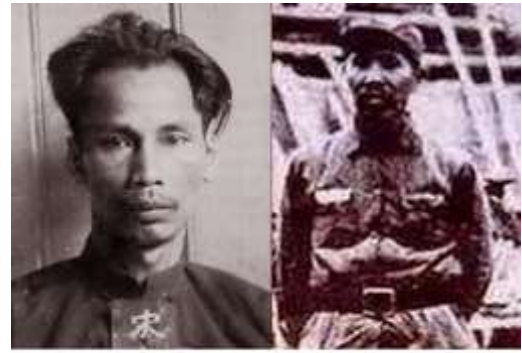
Nguyễn Ái Quốc (1931)

Chiến dịch Cải Cách Ruộng Đất trên lãnh thổ nước Việt Nam Dân Chủ Cộng Hòa, với mục đích xóa bỏ văn hóa truyền thống mà ông hồ gọi là “văn hóa phong kiến”, và tiêu diệt các thành phần mà ông hồ gán cho những cái tên “bóc lột, phản quốc, và phản động”, để lập nên chuyên chính vô sản , và đưa nước Việt Nam Dân Chủ Cộng Hòa tiến lên chủ nghĩa xã hội, theo Bản Tuyên Ngôn đảng cộng sản mà ông Karl Marx đã tuyên bố: “Cách mạng ruộng đất là điều kiện giải phóng dân tộc” .