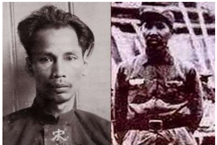
Nguyễn Ái Quốc (1931)