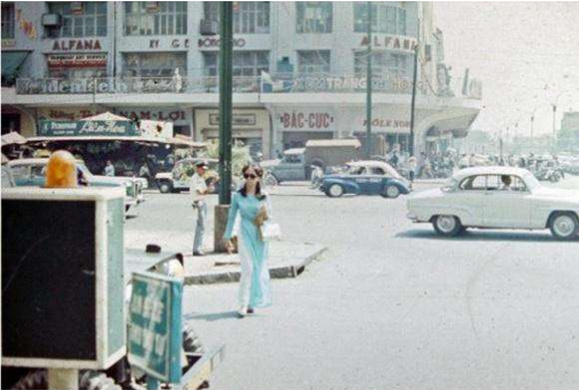
Khách đến với Thương xá Tax đa phần là giới trung lưu và thượng lưu của Sài Gòn thời đó