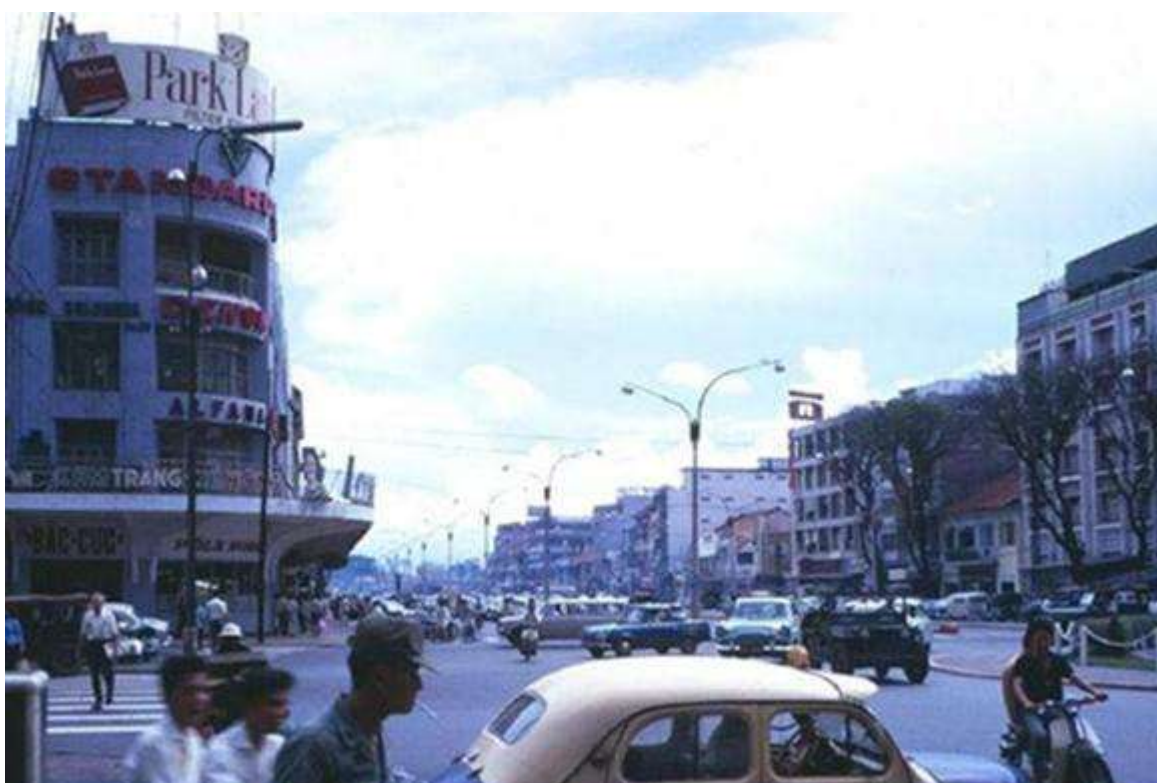
Thương xá Tax năm 1969