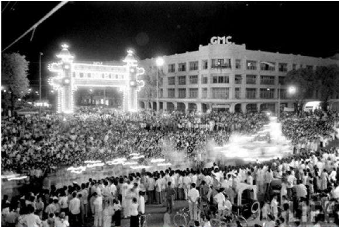
Sau này, để mở rộng, chủ đầu tư đã quyết định đập bỏ tháp đồng hồ của khu thương xá và xây thêm một tầng nữa