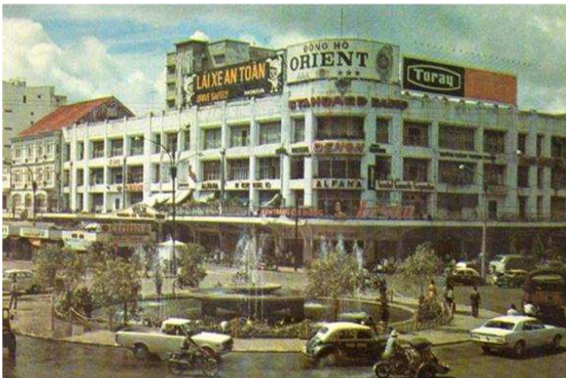
Hình ảnh Thương xá Tax trên một tạp chí nước ngoài