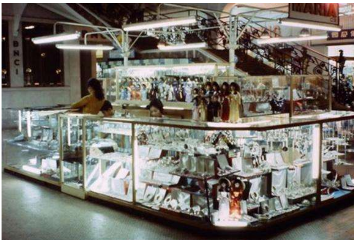
Khung cảnh bên trong Thương xá Tax năm 1965