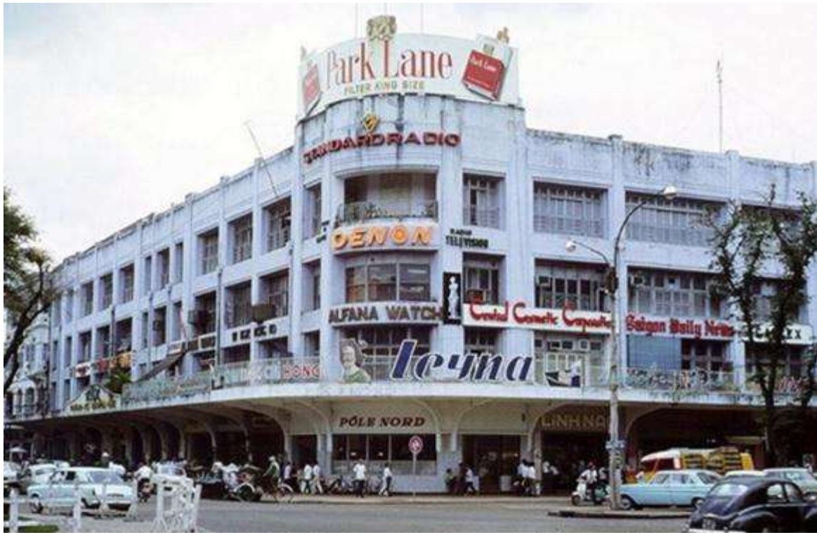
Thêm một hình ảnh nữa về thương xá Tax năm 1966