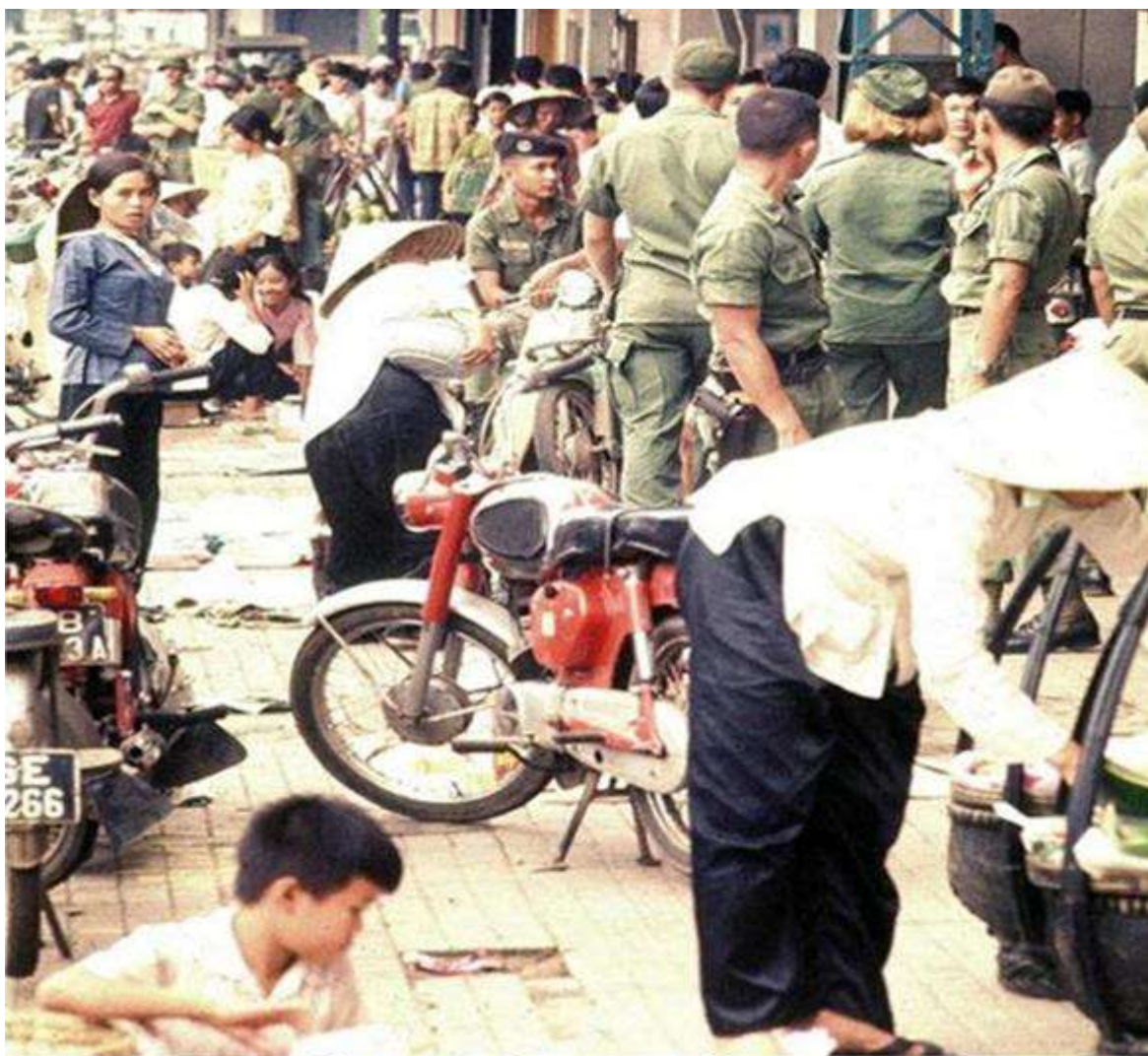
Hè phố Lê Lợi phía trước Thương xá Tax