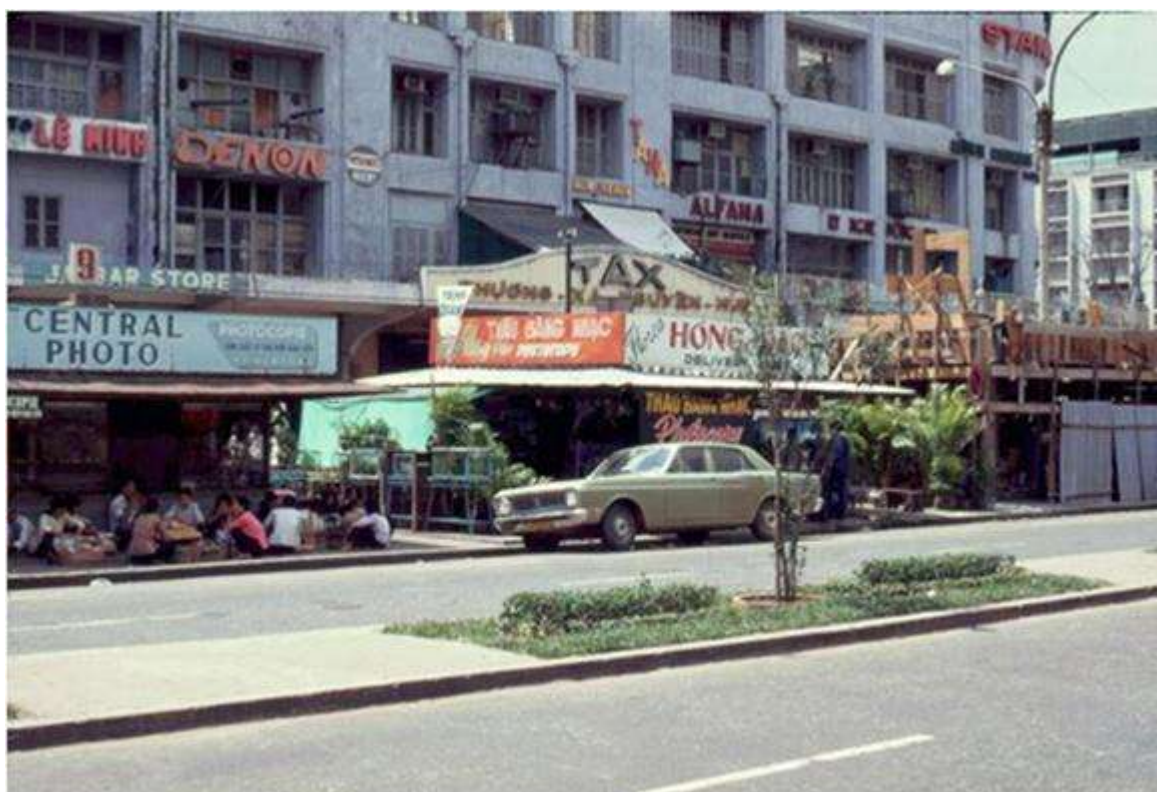
Tầng 1 của thương xá