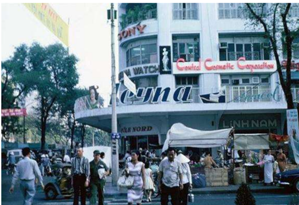
Thương xá Tax năm 1966