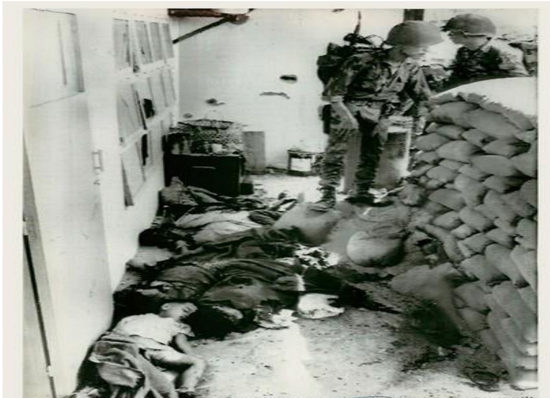
(NY16-Feb.1)DEATH OF A MILITARY FAMILY IN SAIGON SUBURB--South Vietnamese soldiers stand near bodies of a South Vietnamese commander of a training camp and command center and members of his family after the camp was retaken from the Viet Cong in a northern Saigon suburb today. The commander, a colonel, was decapitated by the Viet Cong and his wife and six children were machinegunned. On ground near the corpses are toys and food. At right are sandbags behind which the children hid. (AP wirephoto via radio from Saigon/see AP wire story/IN50842m/1968