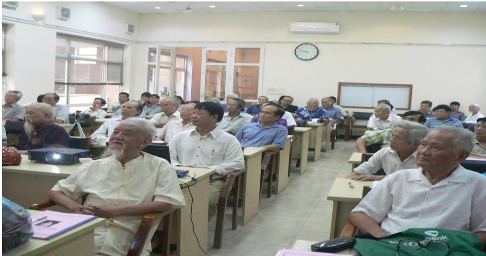
Toàn Cảnh hội trường