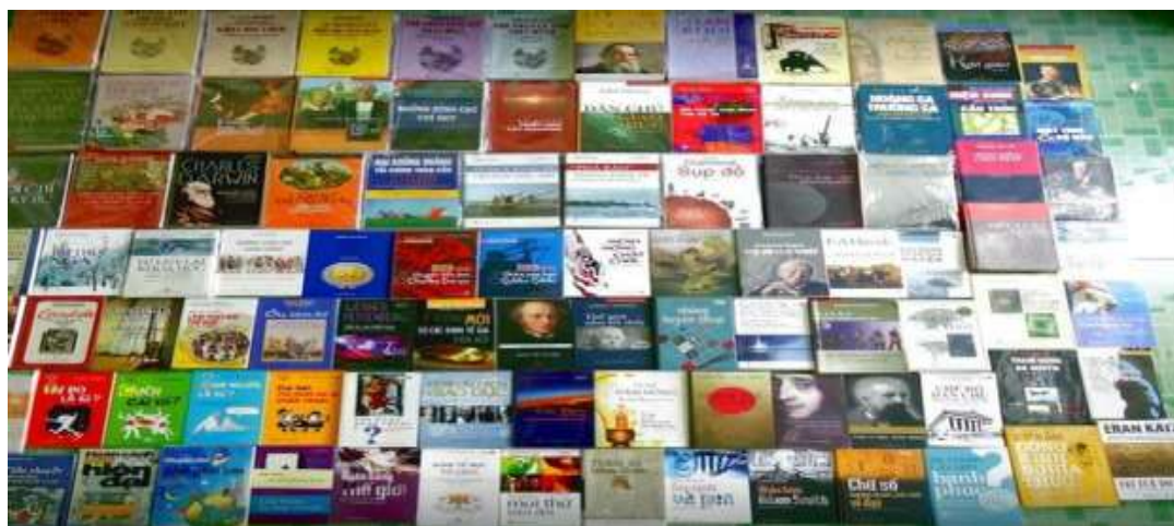
Hình minh họa các đầu sách của Nhà xuất bản Tri Thức