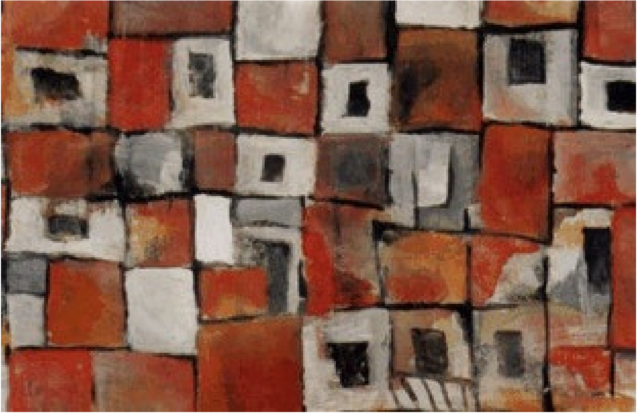
Tranh Phái về lại phố

Vẫn số nhà 87 như xưa, trên tường nhà treo đầy tranh Phái. Những bức ký họa chân dung bạn bè, người thân, những bức tranh chèo... và nhiều nhất vẫn là tranh phố cổ. Người đồng nghiệp đi cùng ngâm ngùi: "Nghĩ cũng lạ, mình là người Hà Nội hẳn hoi. Ngày nào cũng đi qua những dãy nhà này, phố này, vậy mà nhìn tranh phố Phái vẫn thấy có nét gì thật là đặc biệt".