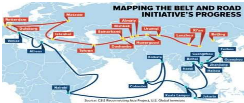
Hành động của Ý cũng gây nhiều tranh cãi tại Washington

Tại Washington hành động của Ý cũng gây nhiều tranh cãi. Một quan chức Mỹ cho biết Mỹ lo ngại rằng động thái bất thường của Ý là dấu hiệu cho thấy các đồng minh của họ ở Âu Châu đang có một thái độ khác, thân thiện hơn đối với Bắc Kinh.