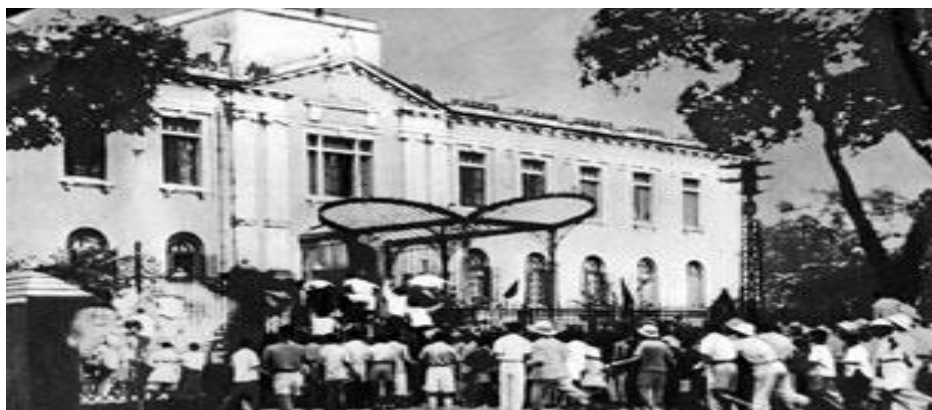
Đoàn người tham gia cuộc mít-tinh trước cửa Bắc Bộ phủ, Hà Nội, hôm 19 tháng 8 năm 1945.