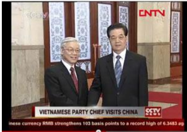
TBT Nguyễn Phú Trọng và Chủ tịch Trung Quốc Hồ Cẩm Đào tại Bắc Kinh hôm 11 tháng 10 năm 2011.

"Nếu Việt Nam biết lợi dụng tình hình, khai thác chuyến đi này của ông Tập Cận Bình để có thái độ cứng rắn đặt ra những vấn đề cụ thể, chứ không phải để nhân nhượng, thì đó có thể là điều thuận lợi cho Việt Nam. Nhưng nếu những người lãnh đạo Việt Nam tiếp tục có thái độ nhu nhược, nhân nhượng, thì theo tôi, họ sẽ không đạt được điều gì tốt cả."